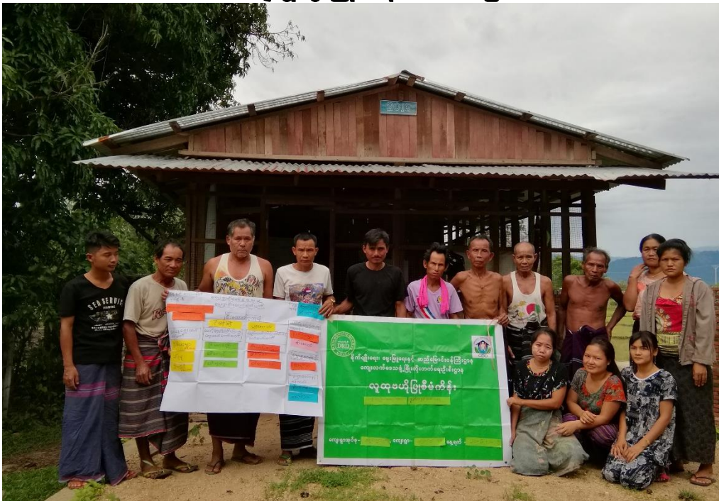
ရေကျော်ကြီးအုပ်စု၊ ကြောင်ရှာကုန်းကျေးရွာ

လူထုဗဟိုပြုစီမံကိန်း ကော့ကရိတ်မြို့နယ်၊ ကရင်ပြည်နယ် ကျေးရွာဖွံ့ဖြိုးရေးအစီအစဉ်