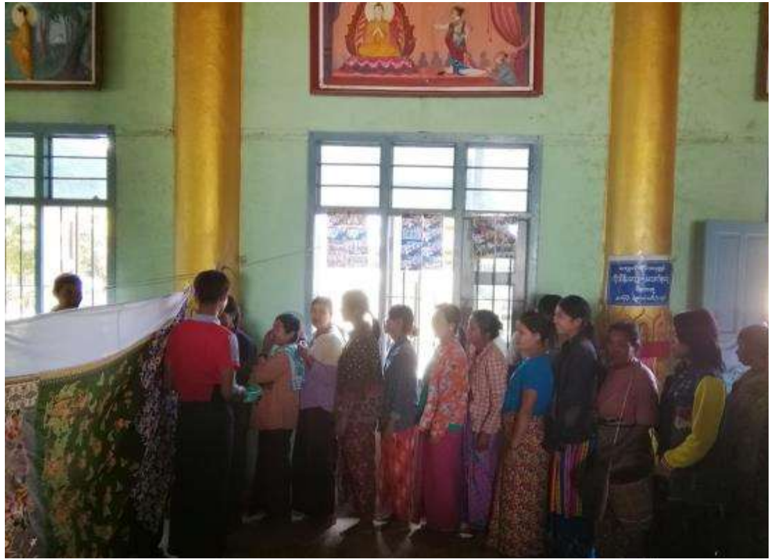
၇။ ကော်မတီဝင်များရွေးချယ်ခြင်းနှင့် ကျေးရွာဖွံ့ဖြိုးရေးအစီအစဉ်ဆောင်ရွက်မှု မှတ်တမ်းဓာတ်ပုံများ