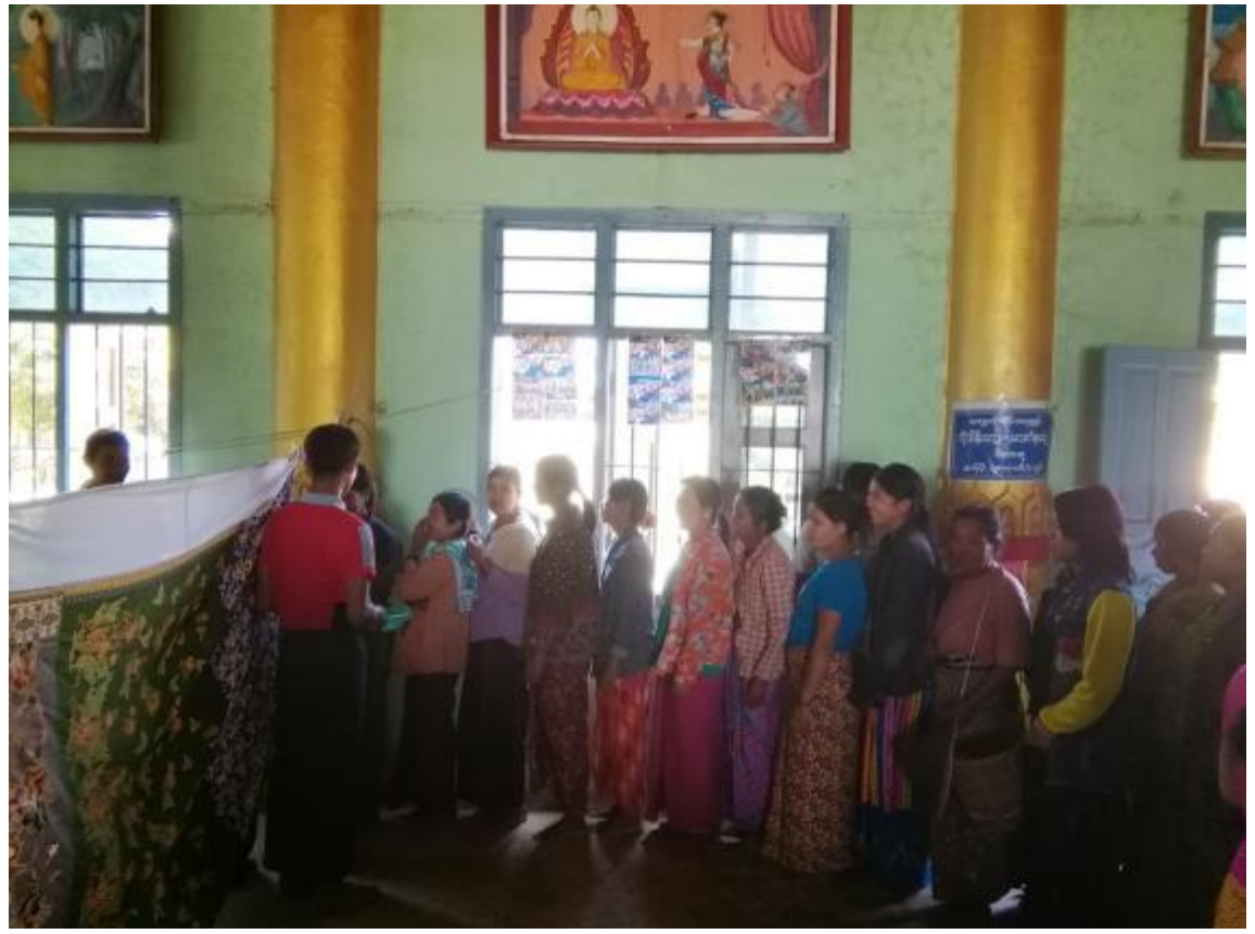
၇။ ကော်မတီဝင်များရွေးချယ်ခြင်းနှင့် ကျေးရွာဖွံ့ဖြိုးရေးအစီအစဉ်ဆောင်ရွက်မှု မှတ်တမ်းဓာတ်ပုံများ