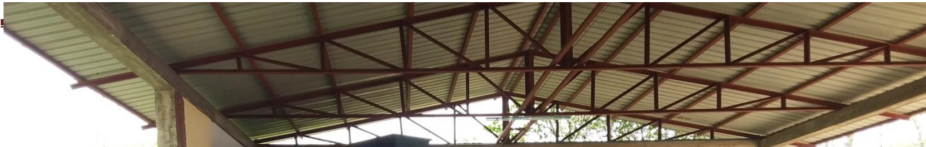
၇။ ကျေးဇူးကော်မတီရွေးချယ်ခြင်းနှင့် ကျေးဇူးဖွဲ့ပြီးရေးအစီအစဉ် ဆောင်ရွက်မှုမှတ်တမ်းဓာတ်ပုံများ