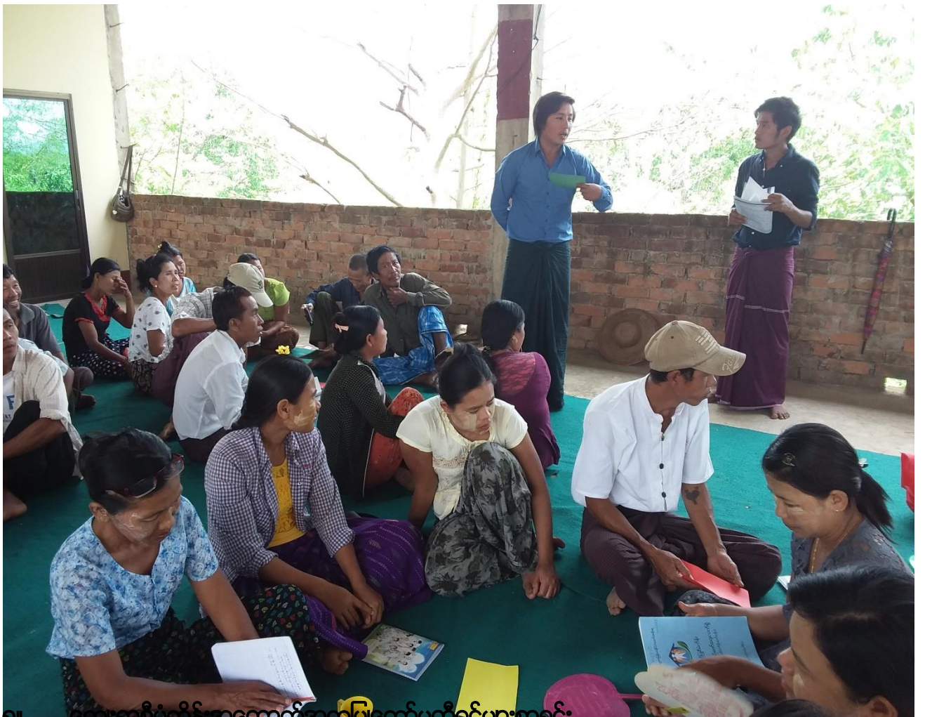
၈၁ မြေရှေးရွာစီမံကိန်းအထောက်အကူပြုကော်မတီဝင်များစာရင်း