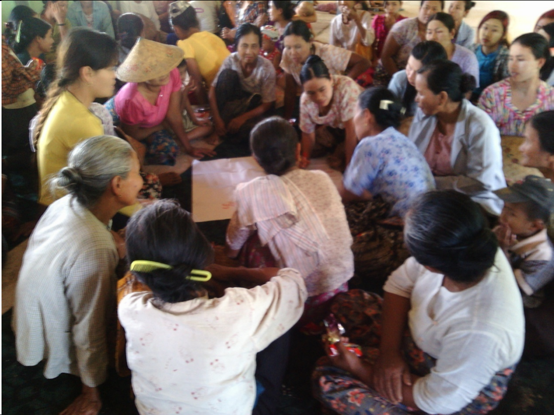
ဖွံ့ဖြိုးရေးအစီအစဉ်ရေးဆွဲခြင်းမှတ်တမ်းဓါတ်ပုံ