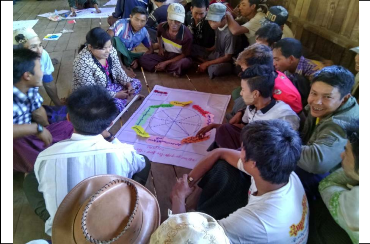
လူငယ်အုပ်စု၏မှတ်တမ်းခါတ်ပုံ