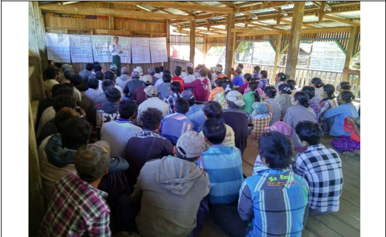
ကော်မတီရွေးချယ်ခြင်းမှတ်တမ်းဓါတ်ပုံ