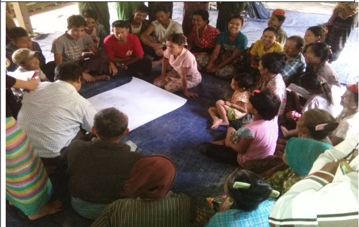
ထိခိုက်လွယ်အုပ်စုများ၏မှတ်တမ်းခါတ်ပုံ