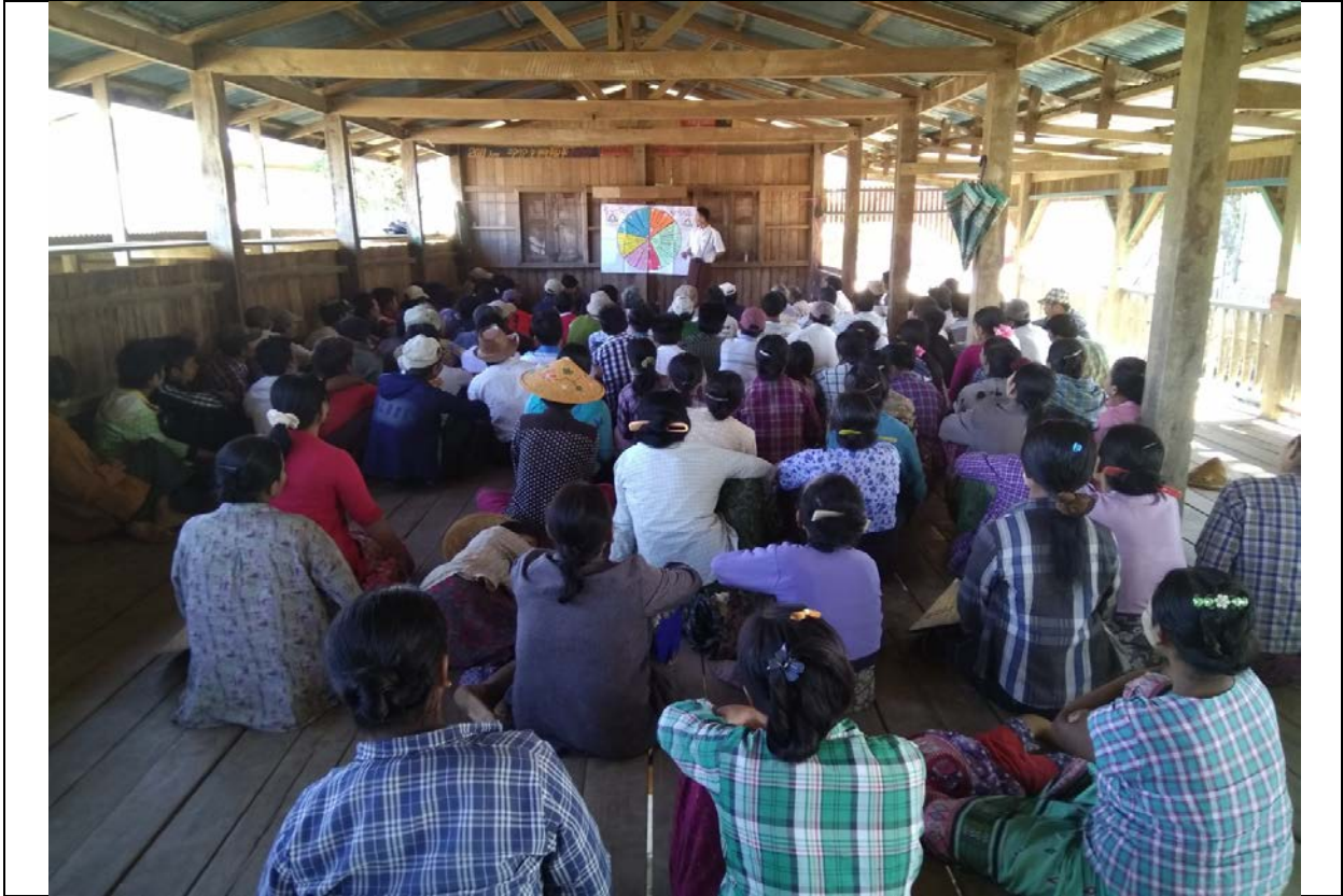
စေတနာ့ဝန်ထမ်းများရွေးချယ်ခြင်းမှတ်တမ်းဓါတ်ပုံ