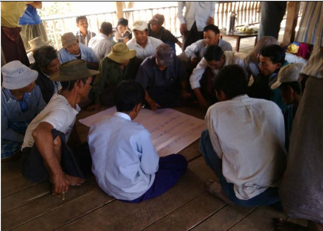
ဖွံ့ဖြိုးရေးအစီအစဉ်ရေးဆွဲခြင်းမှတ်တမ်းဓါတ်ပုံ