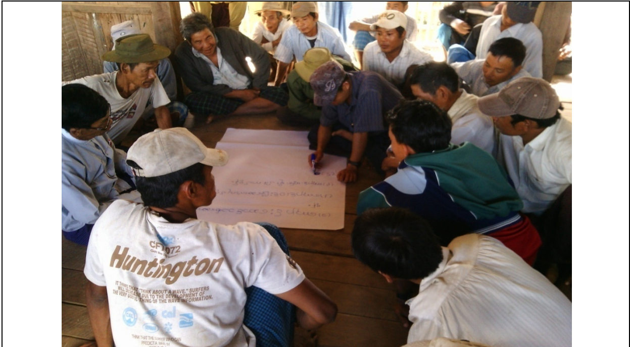
အမျိုးသားအုပ်စု၏မှတ်တမ်းခါတ်ပုံ

၇။ ကော်မတီဝင်များရွေးချယ်ခြင်းနှင့်ကျေးရွာဖွံ့ဖြိုးရေးအစီအစဉ်ဆောင်ရွက်မှုမှတ်တမ်းခါတ်ပုံများ