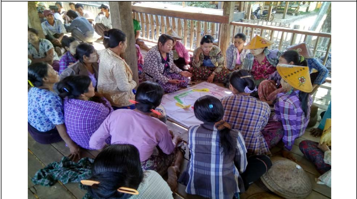
အမျိုးသမီးအုပ်စု၏မှတ်တမ်းခါတ်ပုံ