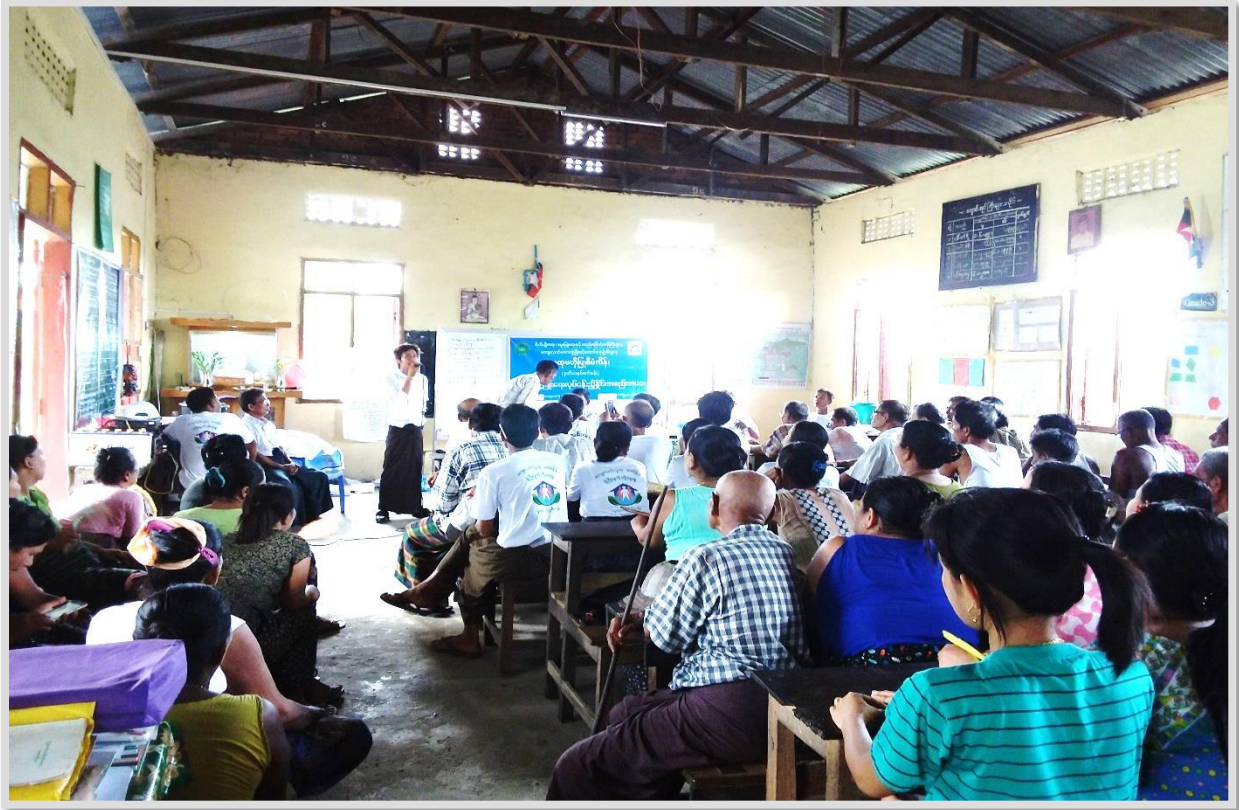
ကျားဘိုကျေးရွာ၊ကျားဘိုကျေးရွာအုပ်စု