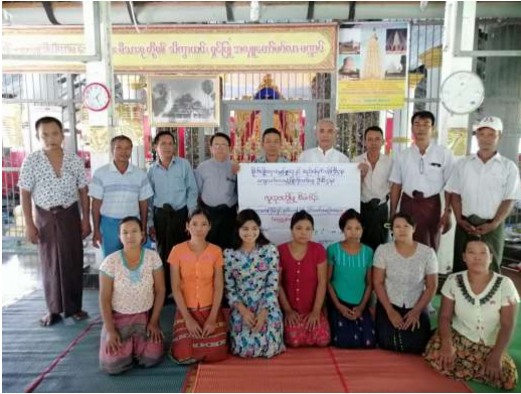
ကော်မတီအဖွဲ့ဝင်များ မှတ်တမ်းဓါတ်ပုံ