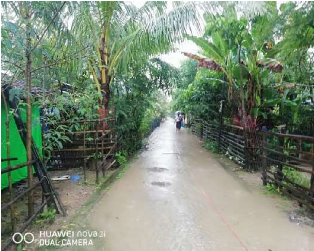
စီမံကိန်းလုပ်ငန်းခွဲ မစတင်မှီမှတ်တမ်း ဓါတ်ပုံ