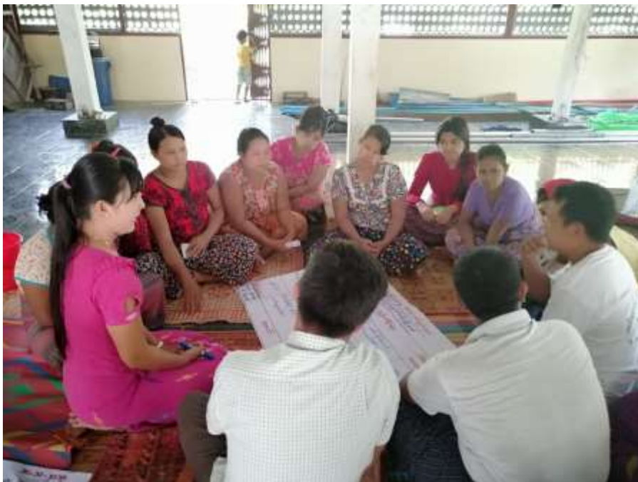
စတုတ္ထနှစ် စီမံကိန်း စက်ဝန်း လူမှုဆန်းစစ်ခြင်း မှတ်တမ်းဓါတ်ပုံ