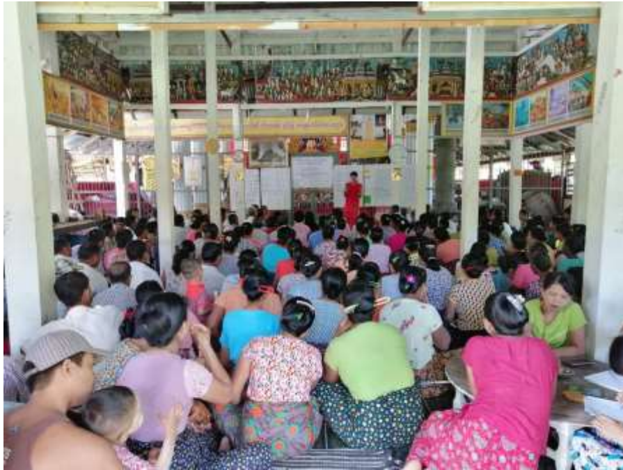
စတုတ္ထနှစ် စီမံကိန်း စက်ဝန်း စီမံကိန်းမိတ်ဆက်အစည်းအဝေးမှတ်တမ်းတင်ဓါတ်ပုံ။