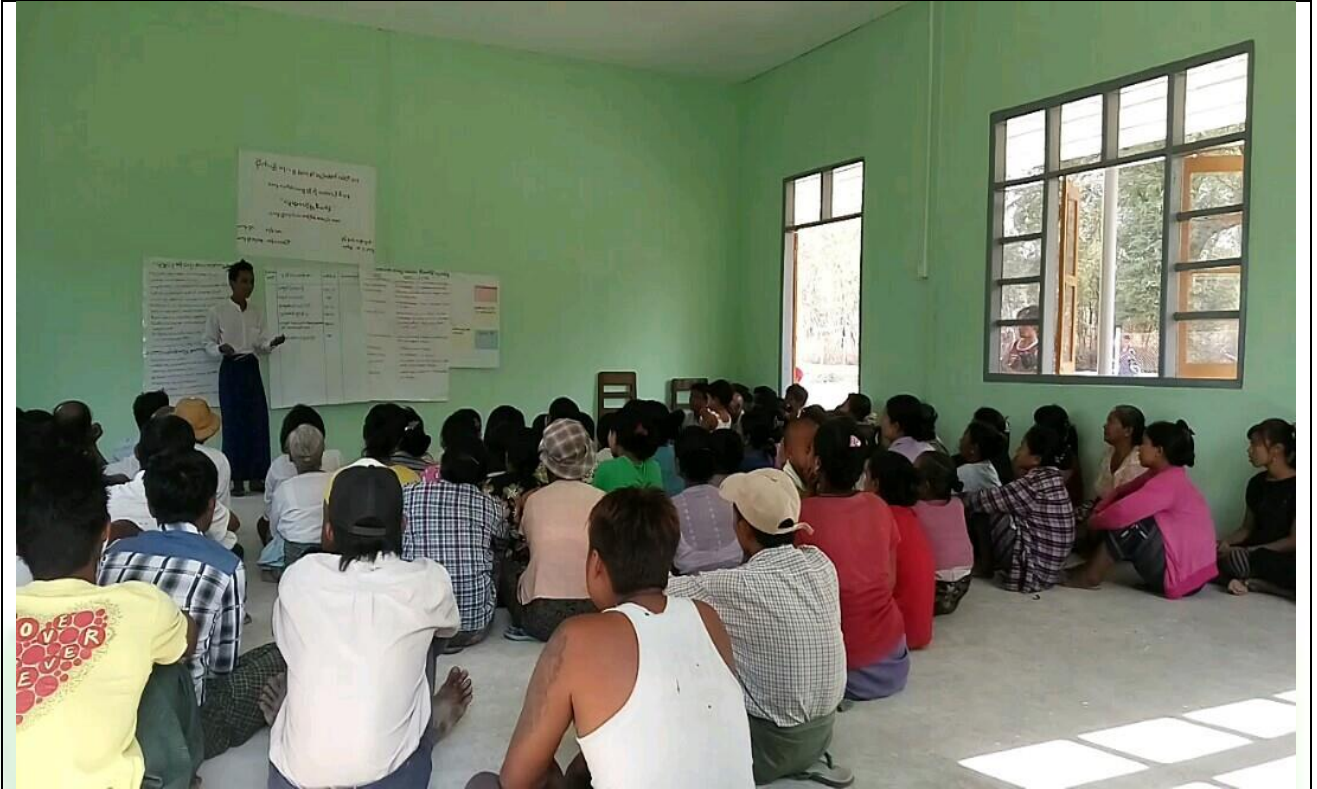
ကော်မတီရွေးချယ်ရန် မဲရေတွက်နေစဉ်