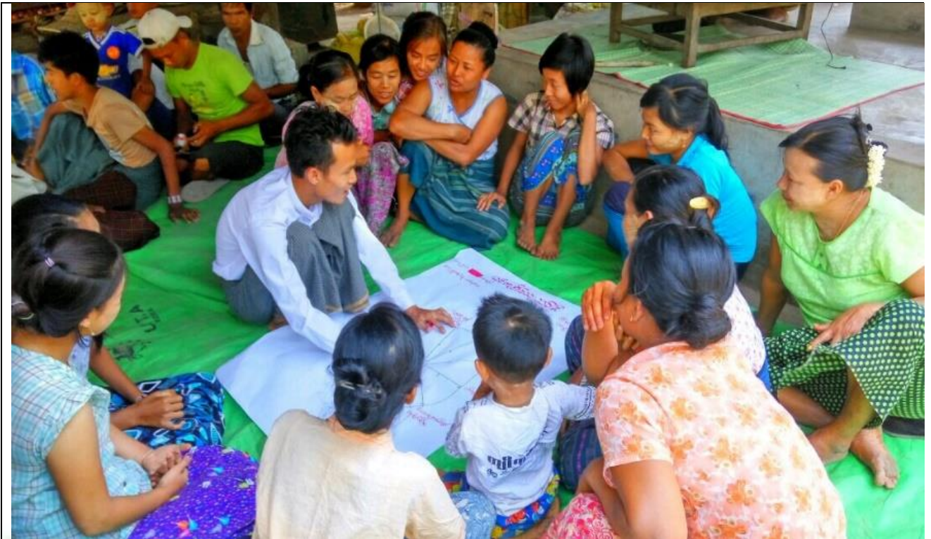
အမျိုးသမီးများပင့်ကူအိမ်ကွန်ယက်ရေးဆွဲနေစဉ် မှတ်တမ်းဓာတ်ပုံ