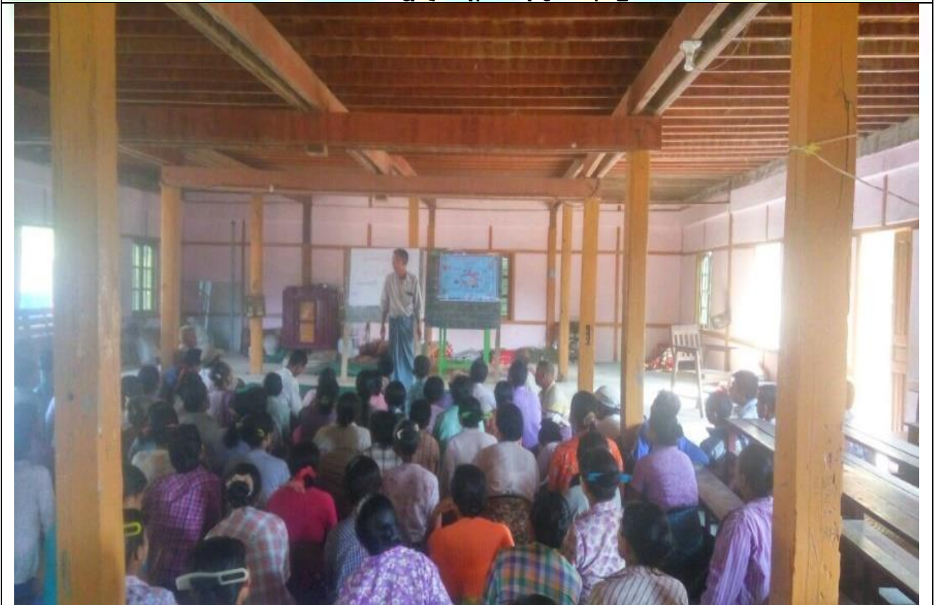
စီမံကိန်းမိတ်ဆက်အစည်းအဝေး မှတ်တမ်းဓါတ်ပုံ