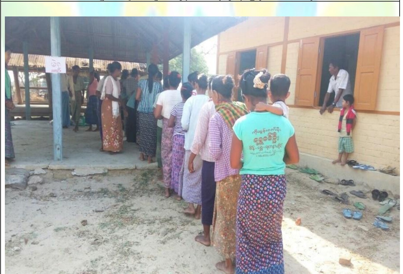
ကျေးရွာဖွံ့ဖြိုးရေးဦးစားပေးမဲပေးရန်တန်းစီနေကြစဉ်