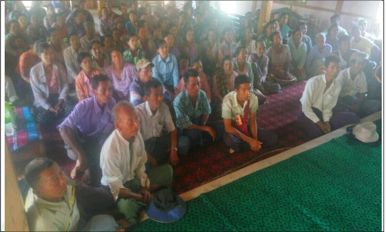
ကျေးရွာလုပ်ငန်းခွဲအတွက်အခက်အခဲများဖော်ထုတ်ဆွေးနွေးစဉ်