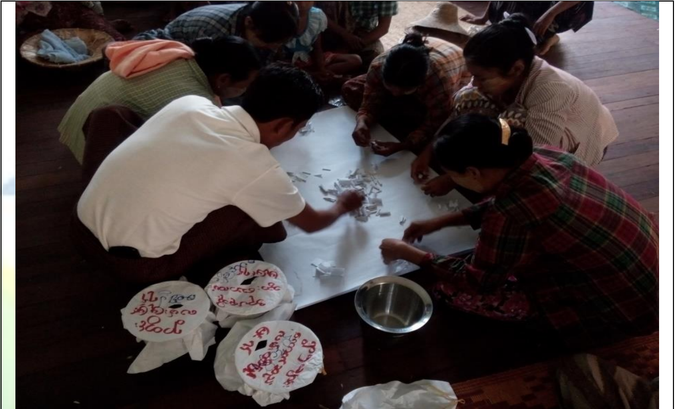
ကော်မတီရွေးချယ်ရန် မဲရေတွက်နေစဉ်