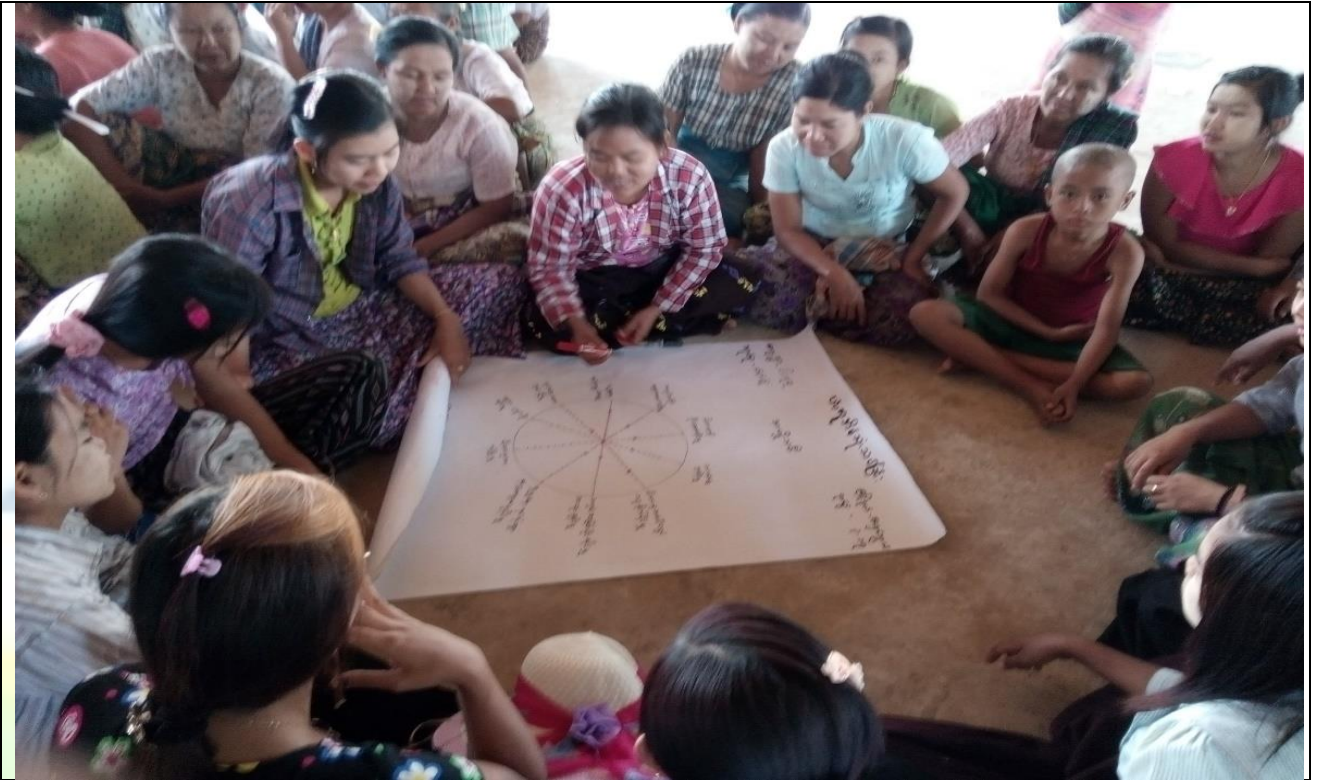
အမျိုးသမီးများပင့်ကူအိမ်ကွန်ယက်ရေးဆွဲနေစဉ် မှတ်တမ်းဓာတ်ပုံ