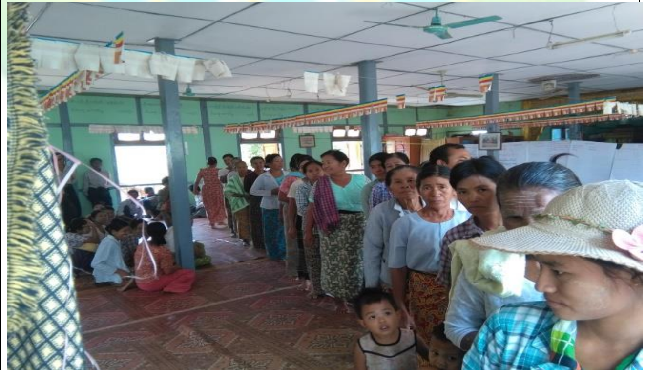
ကျေးရွာဖွံ့ဖြိုးရေးဦးစားပေးမဲပေးရန်တန်းစီနေကြစဉ်