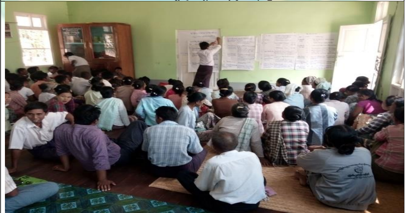
စီမံကိန်းမိတ်ဆက်အစည်းအဝေး မှတ်တမ်းဓါတ်ပုံ