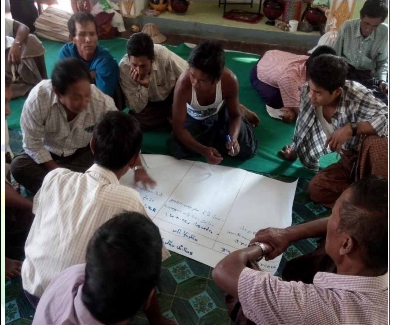
ကျေးရွာလုပ်ငန်းခွဲအတွက်အခက်အခဲများဖော်ထုတ်ဆွေးနွေးစဉ်