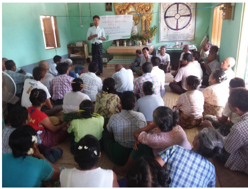
Village Development Plan (VDP)