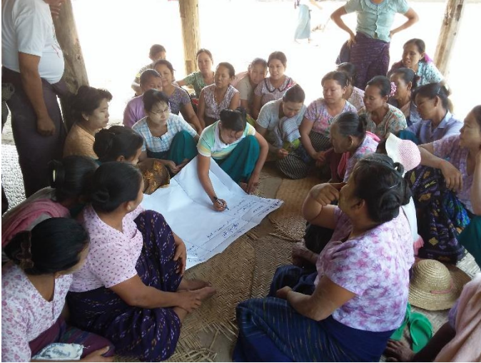
၇။ (က) ကော်မတီဝင်များရွေးချယ်ခြင်းနှင့် ကျေးရွာဖွံ့ဖြိုးရေးအစီအစဉ်ဆောင်ရွက်မှုမှတ်တမ်းဓါတ်ပုံများ