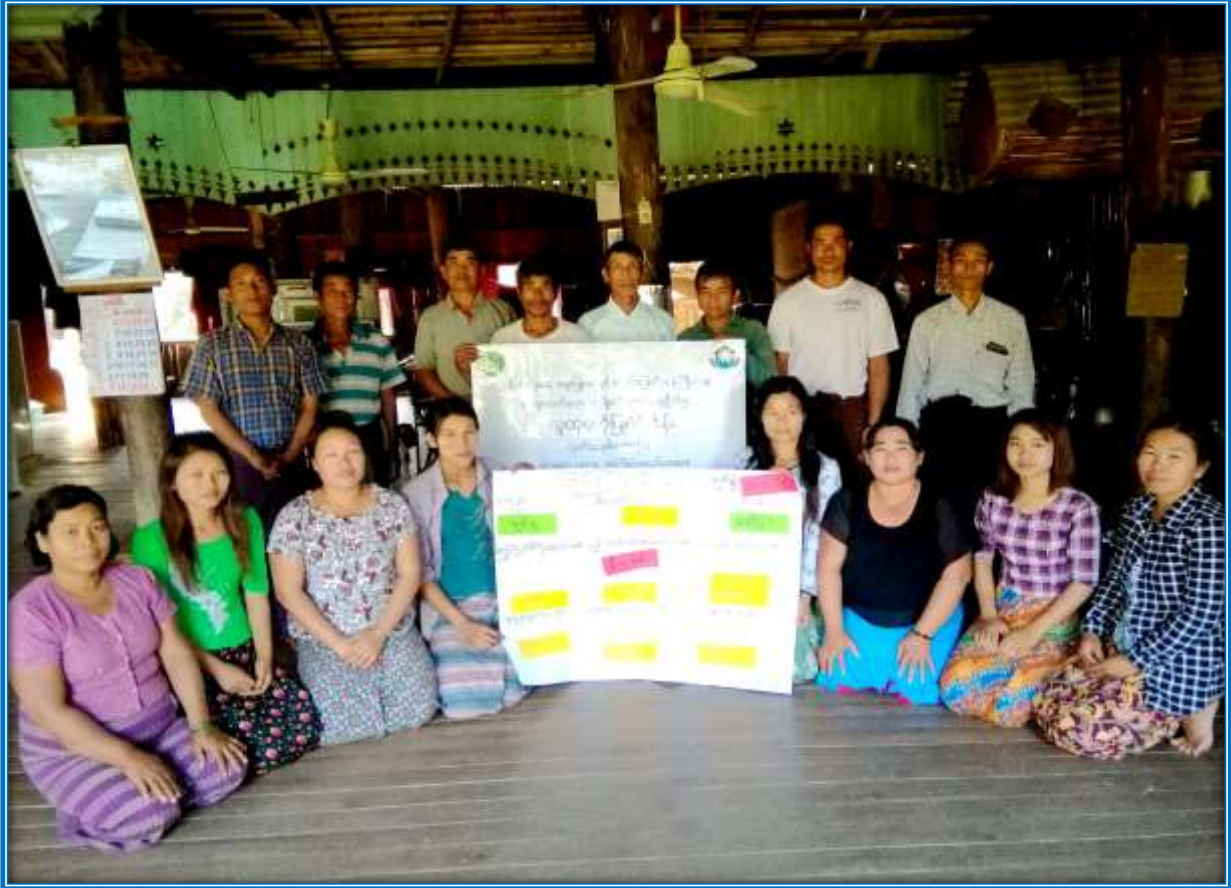
၇။ ကော်မတီဝင်များရွေးချယ်ခြင်းနှင့် ကျေးရွာဖွံ့ဖြိုးရေးအစီအစဉ်ဆောင်ရွက်မှု မှတ်တမ်းဓါတ်ပုံများ