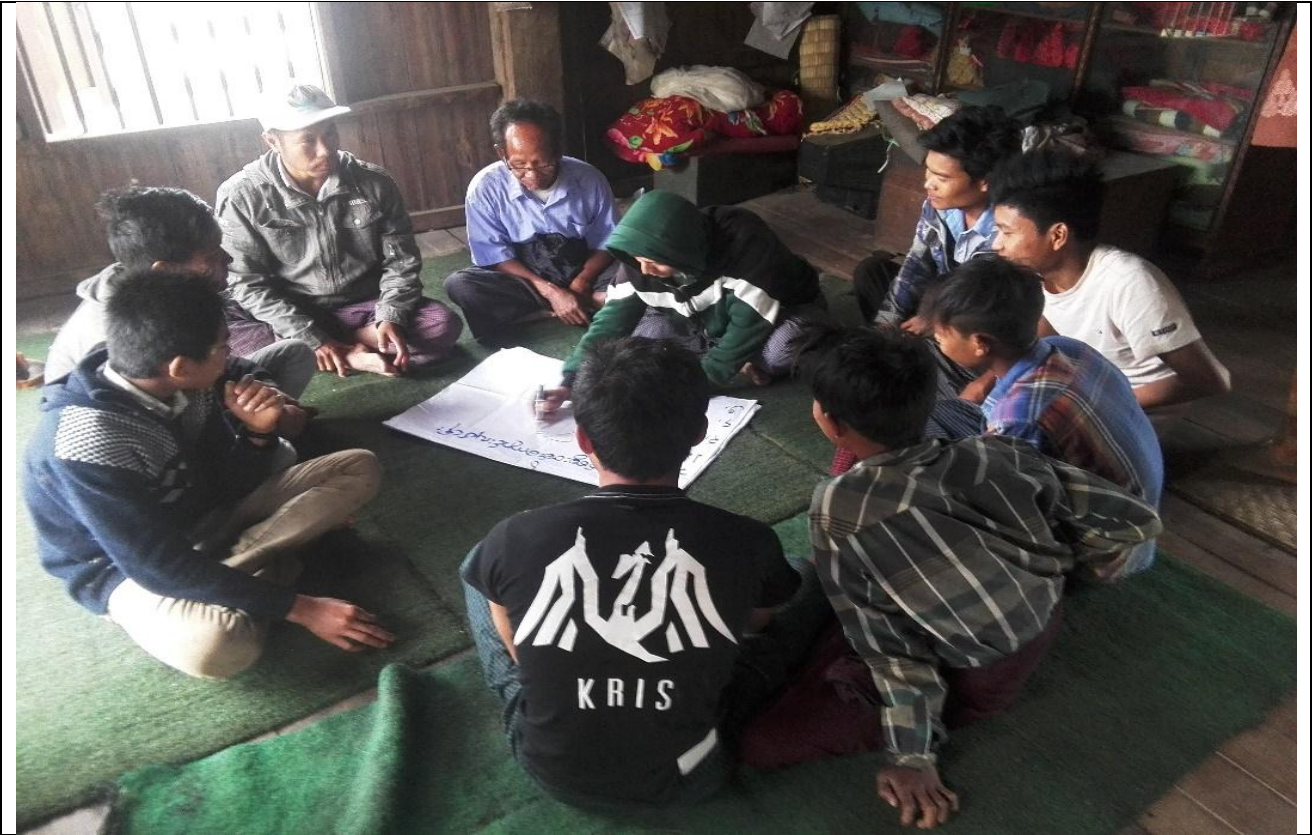
အမျိုးသားအုပ်စု၏ မှတ်တမ်းဓါတ်ပုံ