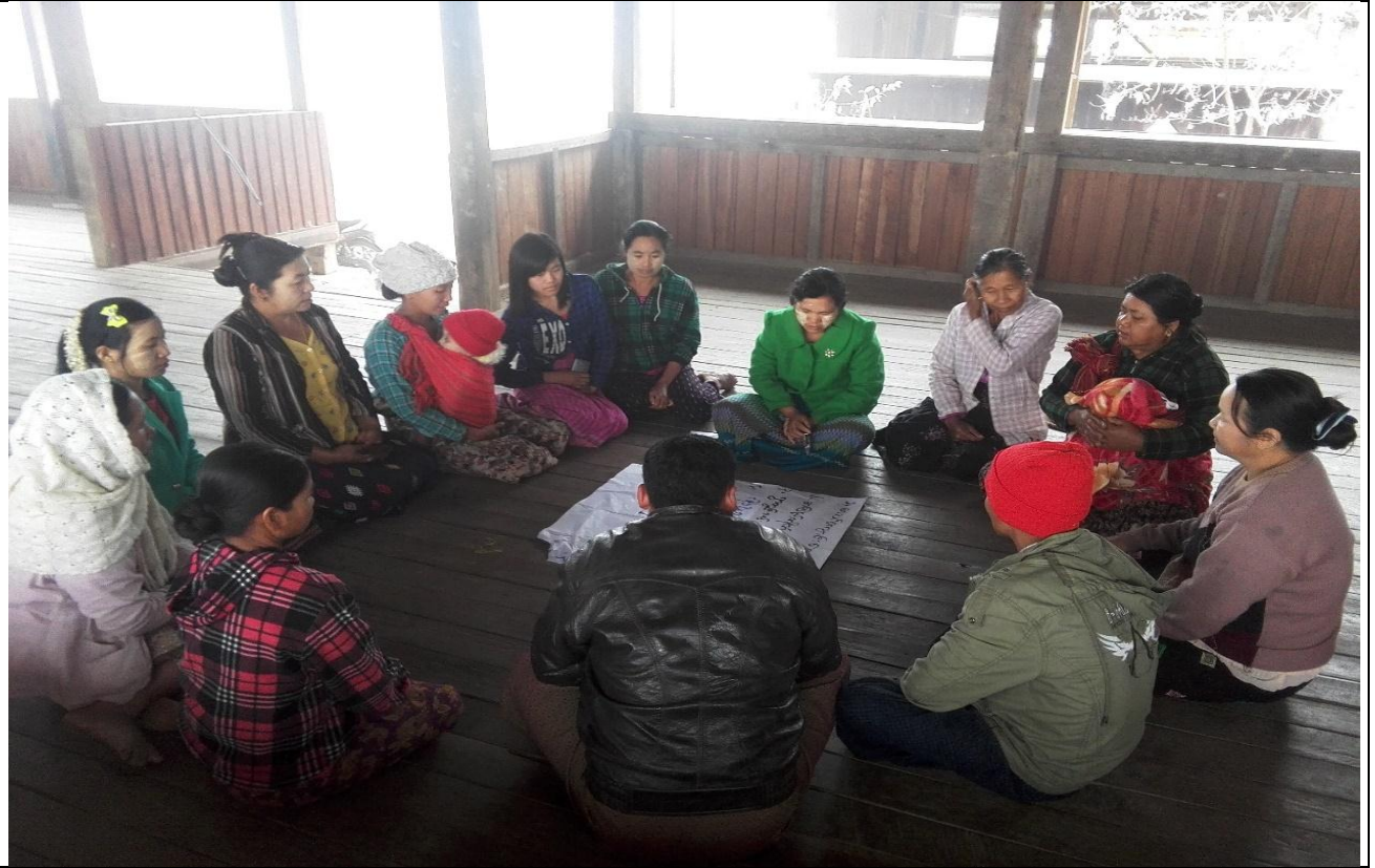
ဖွံ့ဖြိုးရေးအစီအစဉ်ရေးဆွဲခြင်း မှတ်တမ်းခါတ်ပုံ