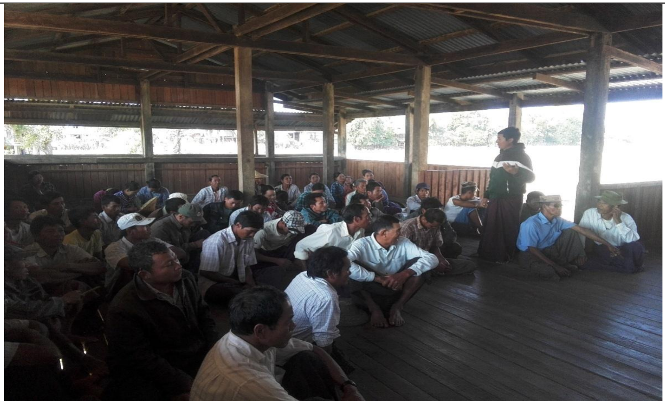
ကော်မတီရွေးချယ်ခြင်း မှတ်တမ်းခါတ်ပုံ