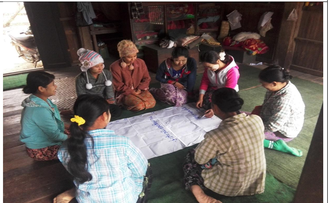
ဖွံ့ဖြိုးရေးအစီအစဉ်ရေးဆွဲခြင်း မှတ်တမ်းခါတ်ပုံ