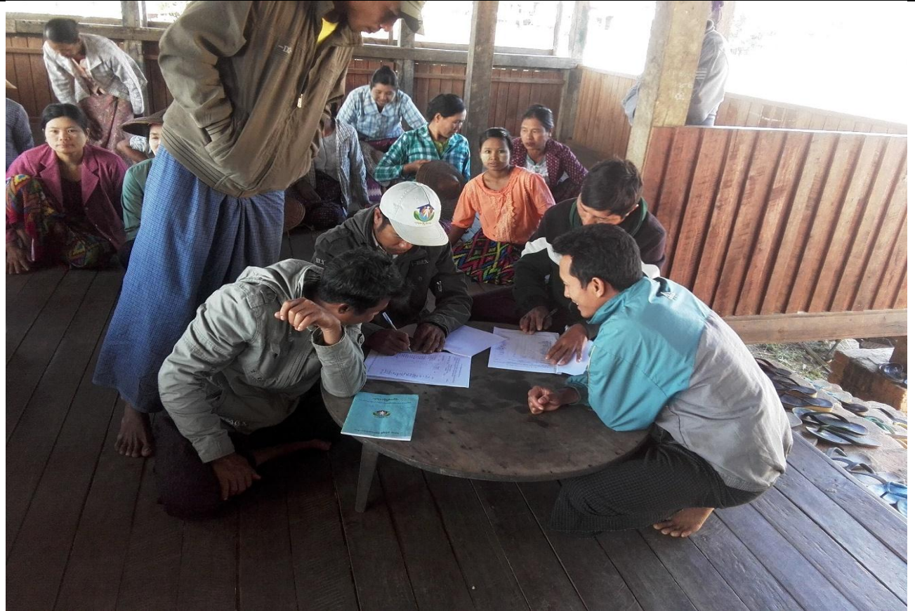
စေတနာ့ဝန်ထမ်းများ ရွေးချယ်ခြင်း မှတ်တမ်းခါတ်ပုံ