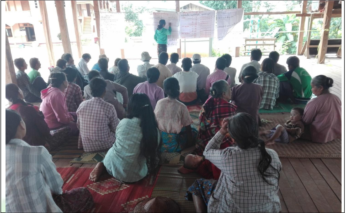
စေတနာ့ဝန်ထမ်းများ ရွေးချယ်ခြင်း မှတ်တမ်းဓါတ်ပုံ