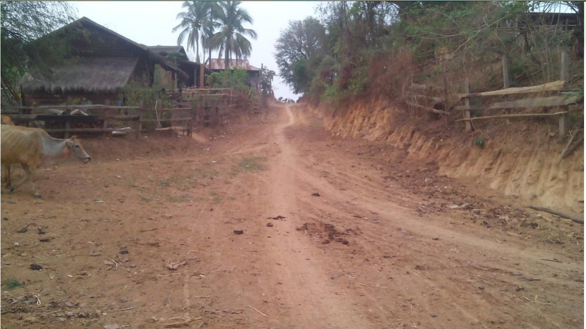
တတိယနှစ်စီမံကိန်းလုပ်ငန်းခွဲဆောင်ရွက်ပြီးစီးမှုမှတ်တမ်းဓာတ်ပုံ