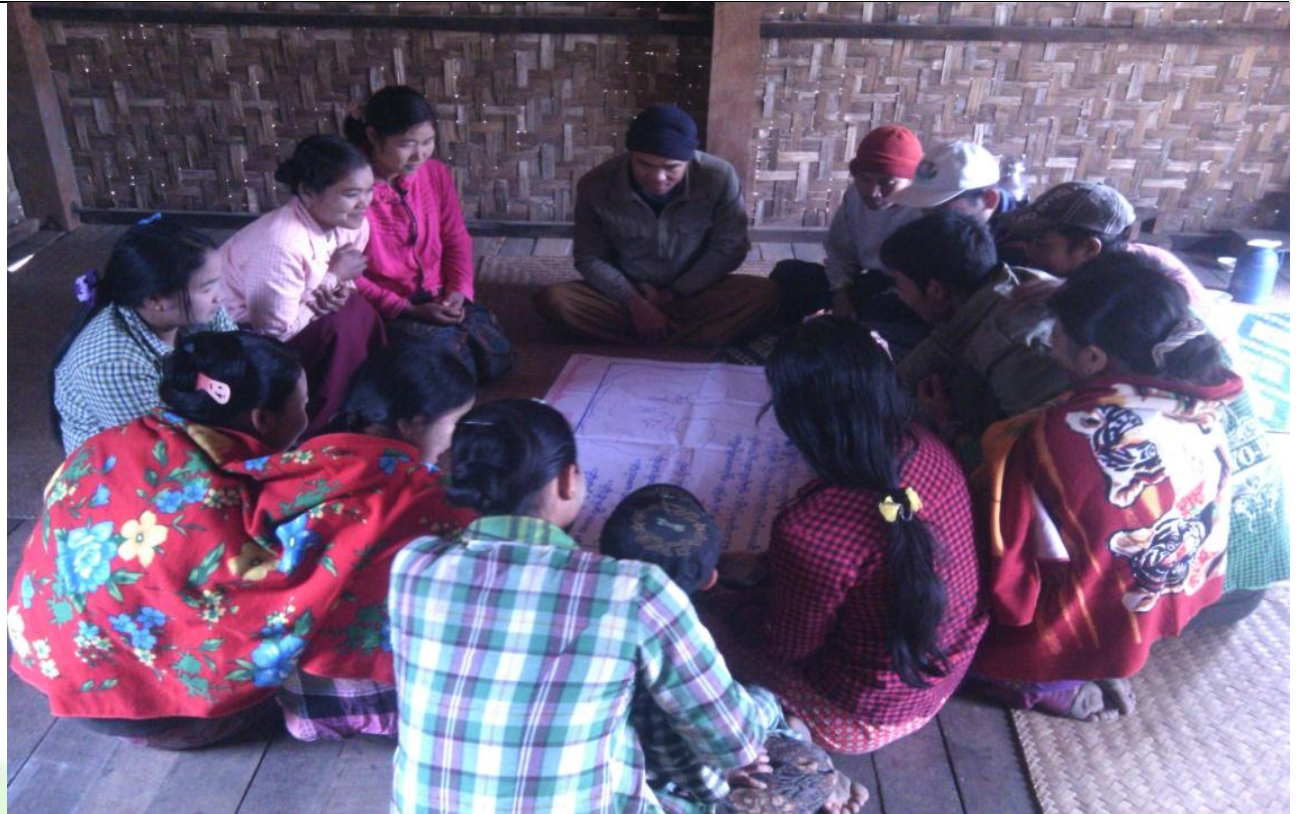
လူငယ်အုပ်စု၏ မှတ်တမ်းခါတ်ပုံ