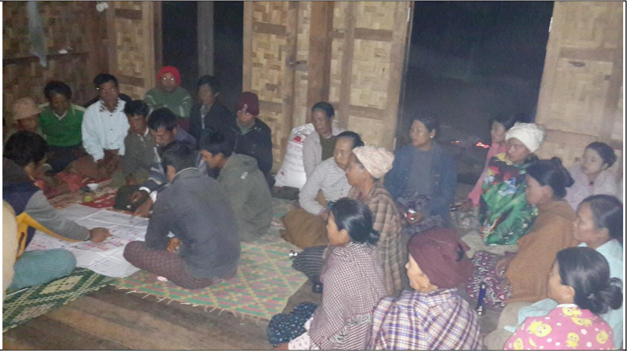
ကော်မတီရွေးချယ်ခြင်း မှတ်တမ်းခါတ်ပုံ