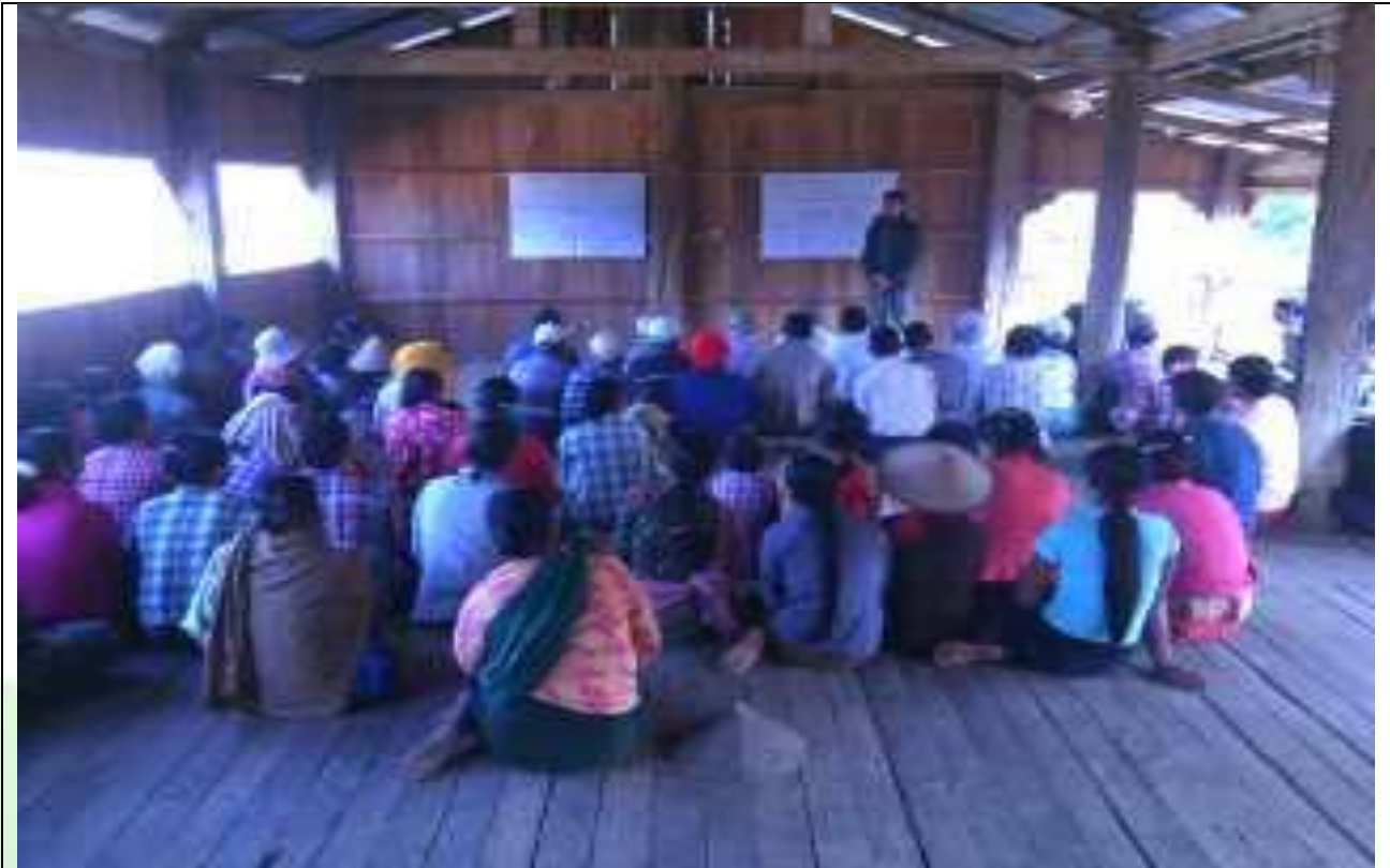
အမျိုးသားအုပ်စု၏ မှတ်တမ်းခါတ်ပုံ