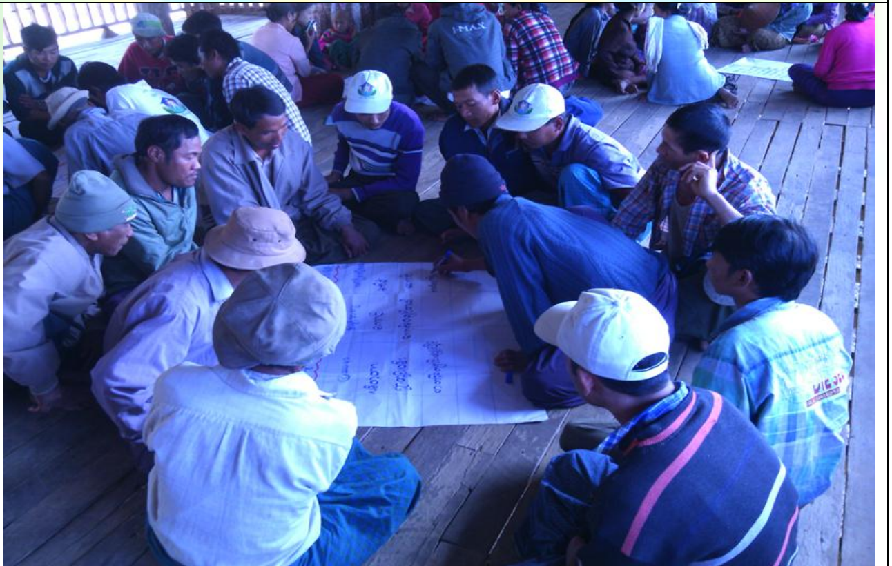
ဖွံ့ဖြိုးရေးအစီအစဉ်ရေးဆွဲခြင်း မှတ်တမ်းခါတ်ပုံ