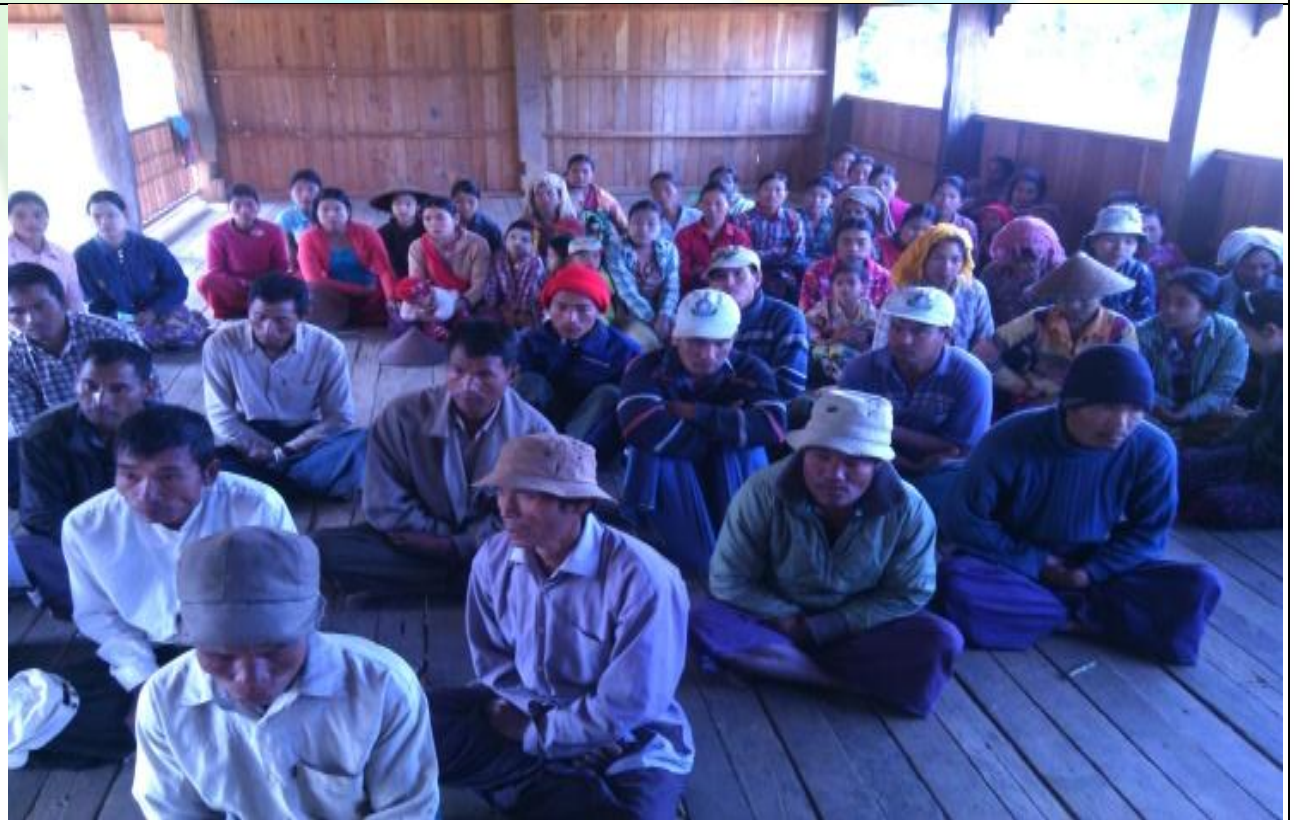
စေတနာ့ဝန်ထမ်းများ ရွေးချယ်ခြင်းမှတ်တမ်းခါတ်ပုံ