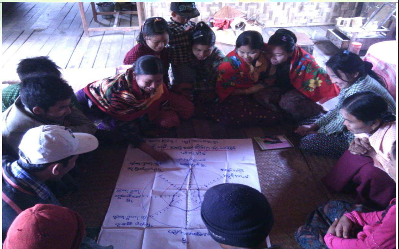
လူငယ်အုပ်စု၏ မှတ်တမ်းခါတ်ပုံ