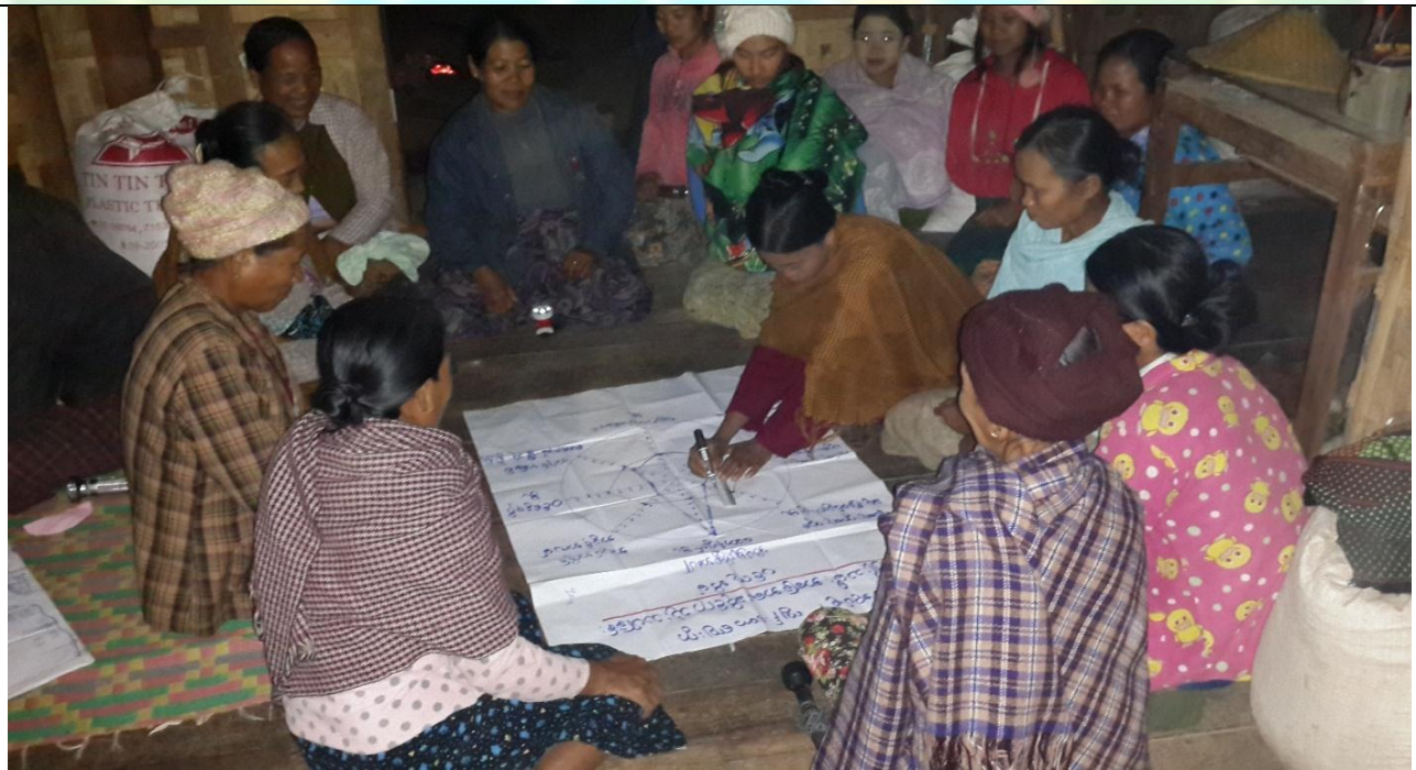
အမျိုးသမီးအုပ်စု၏ မှတ်တမ်းခါတ်ပုံ