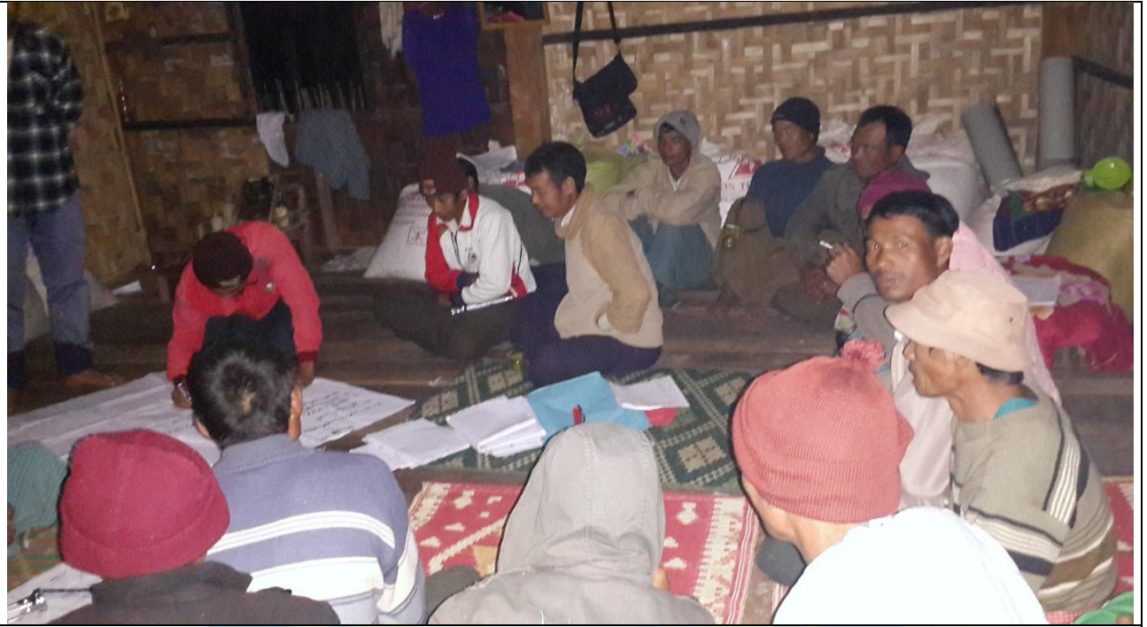
ထိန်ကလွယ်အုပ်စုများ၏ မှတ်တမ်းခါတ်ပုံ