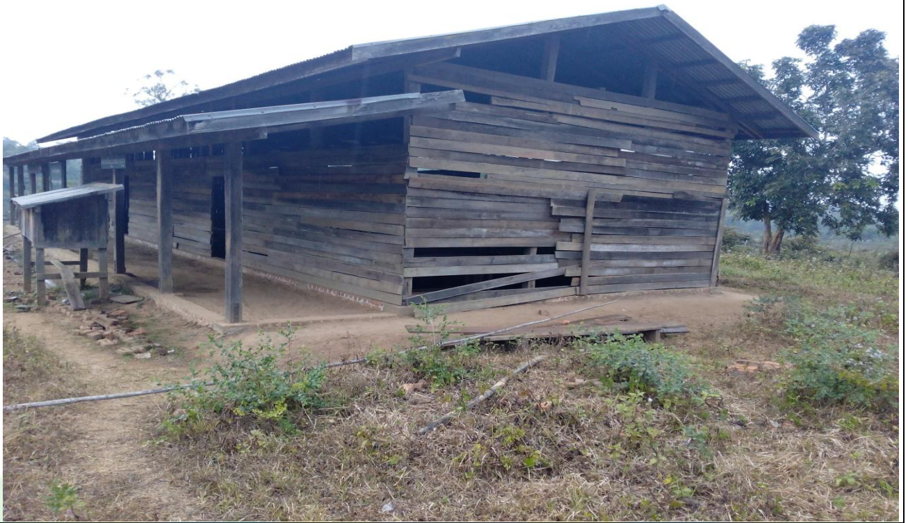
လုပ်ငန်းခွဲ၏မပြုလုပ်မီ မှတ်တမ်းဓာတ်ပုံ