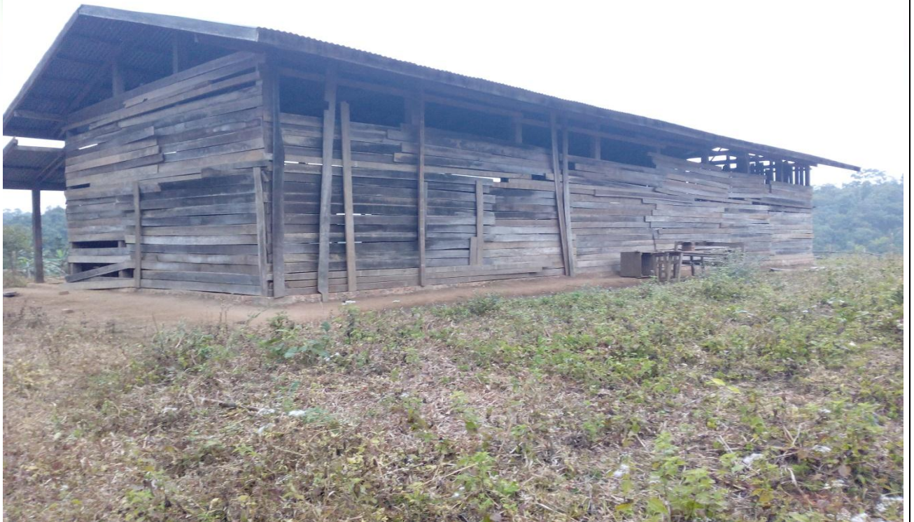
လုပ်ငန်းခွဲ၏မပြုလုပ်မီ မှတ်တမ်းဓာတ်ပုံ