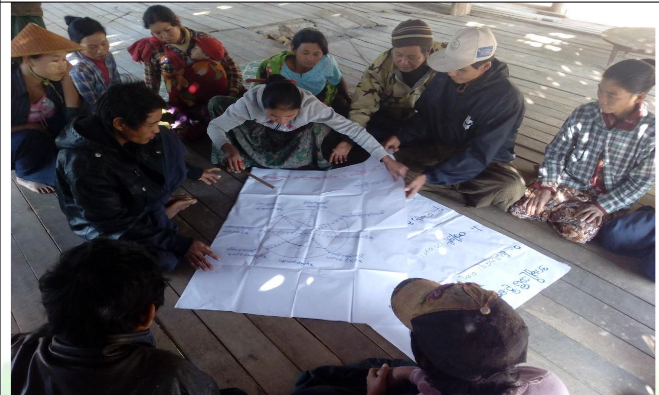
လူငယ်အုပ်စု၏ မှတ်တမ်းခတ်ပုံ