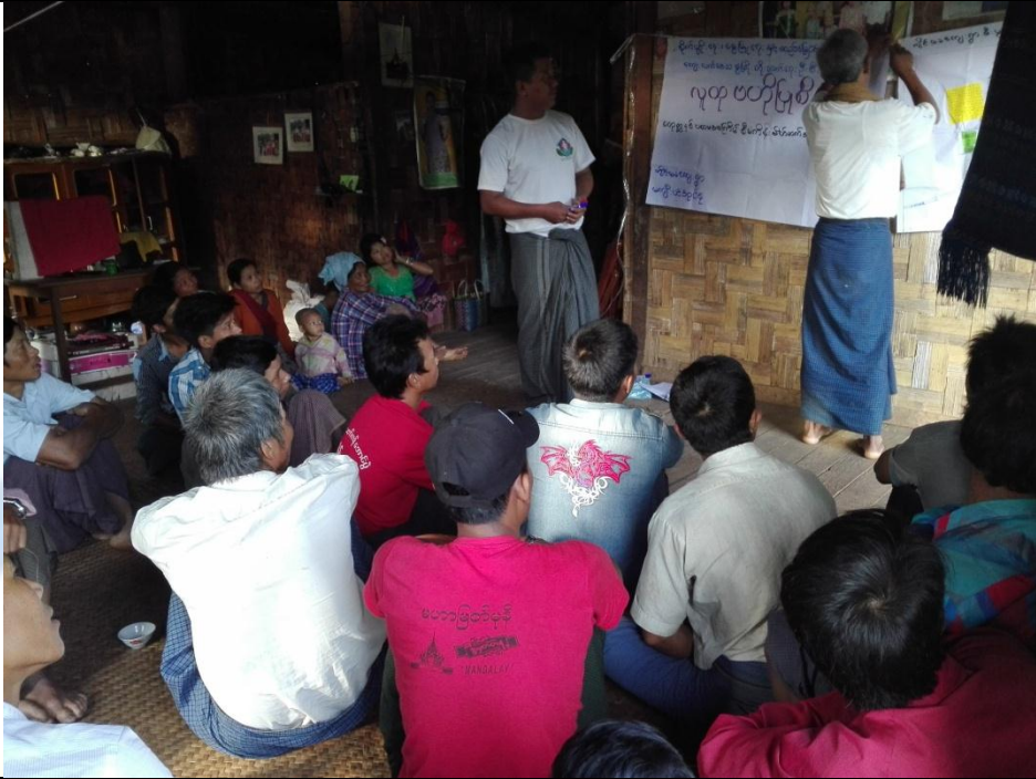
စေတနာ့ဝန်ထမ်းများ ရွေးချယ်ခြင်း မှတ်တမ်းဓာတ်ပုံ