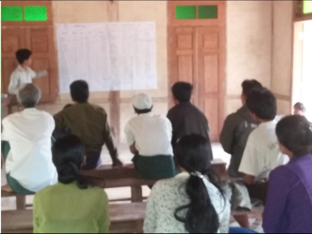
ဖွံ့ဖြိုးရေးအစီအစဉ်ရေးဆွဲခြင်း မှတ်တမ်းဓါတ်ပုံ