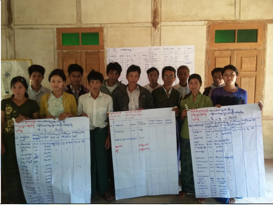
ဖွံ့ဖြိုးရေးအစီအစဉ်ရေးဆွဲခြင်း မှတ်တမ်းဓါတ်ပုံ