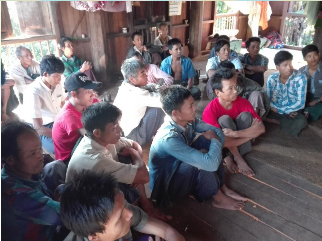
ကော်မတီရွေးချယ်ခြင်း မှတ်တမ်းဓာတ်ပုံ