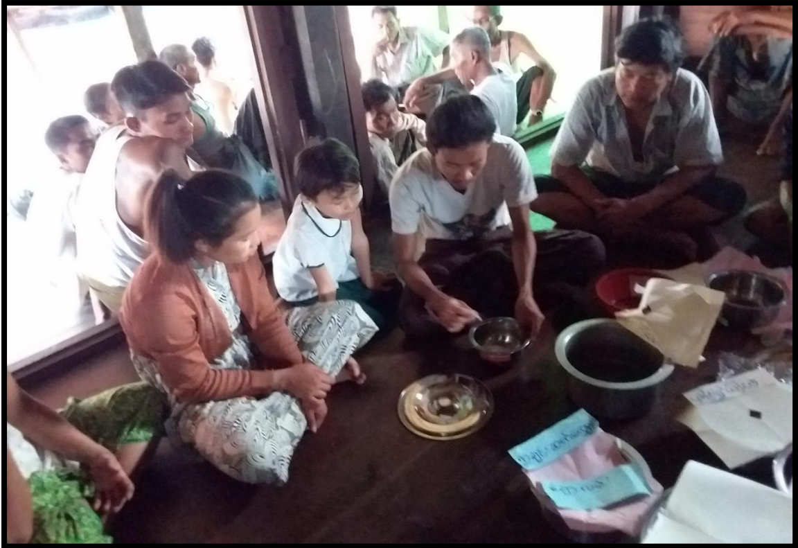
၇။ ကော်မတီဝင်များရွေးချယ်ခြင်းနှင့် ကျေးရွာဖွံ့ဖြိုးရေးအစီအစဉ်ဆောင်ရွက်မှုမှတ်တမ်းဓာတ်ပုံများ