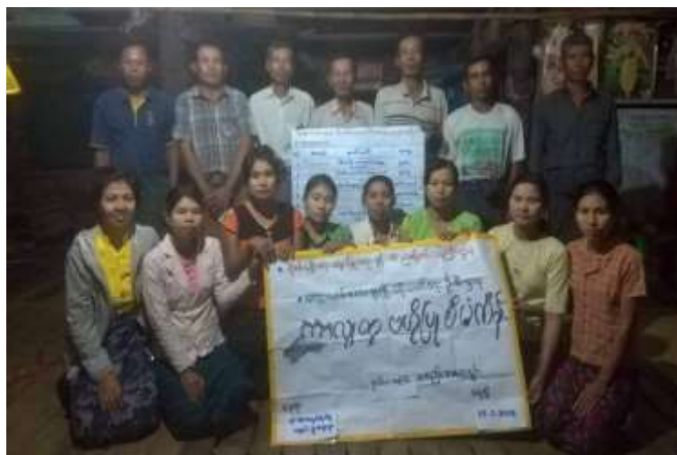
ကင်းသန်းကျေးရွာ စီမံကိန်းအထောက်အကူပြု ကော်မတီဝင်များ