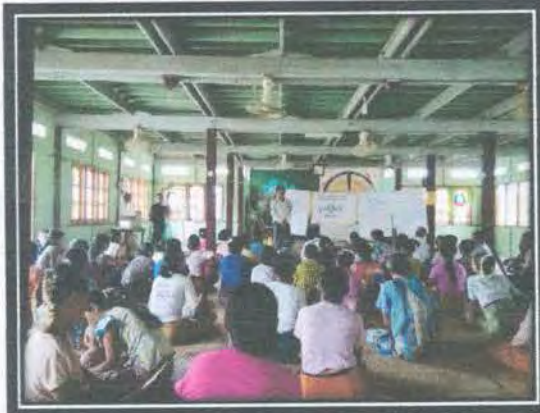
ခုံကြီးကျေးရွာအုပ်စု