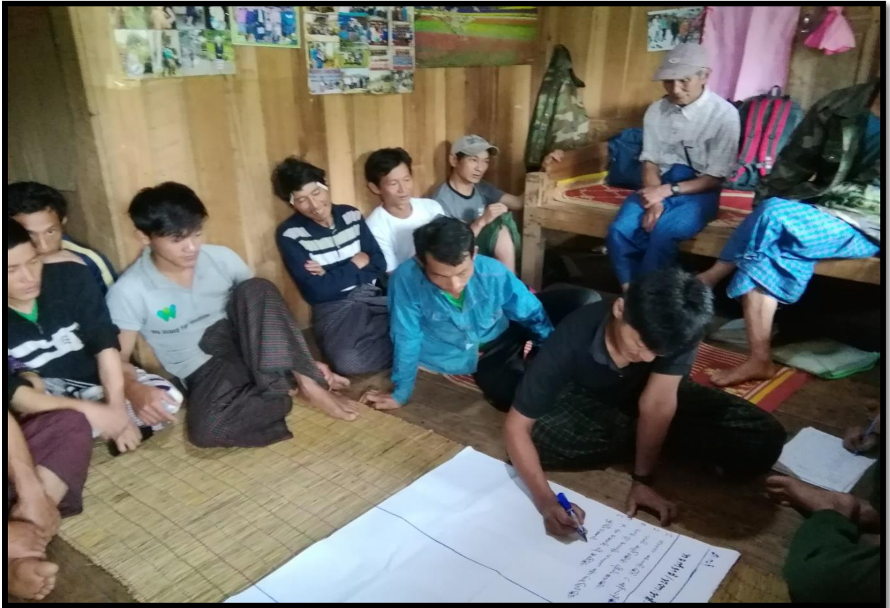
၇။ ကော်မတီဝင်များရွေးချယ်ခြင်းနှင့် ကျေးရွာဖွံ့ဖြိုးရေးအစီအစဉ် ဆောင်ရွက်မှု မှတ်တမ်းဓါတ်ပုံများ