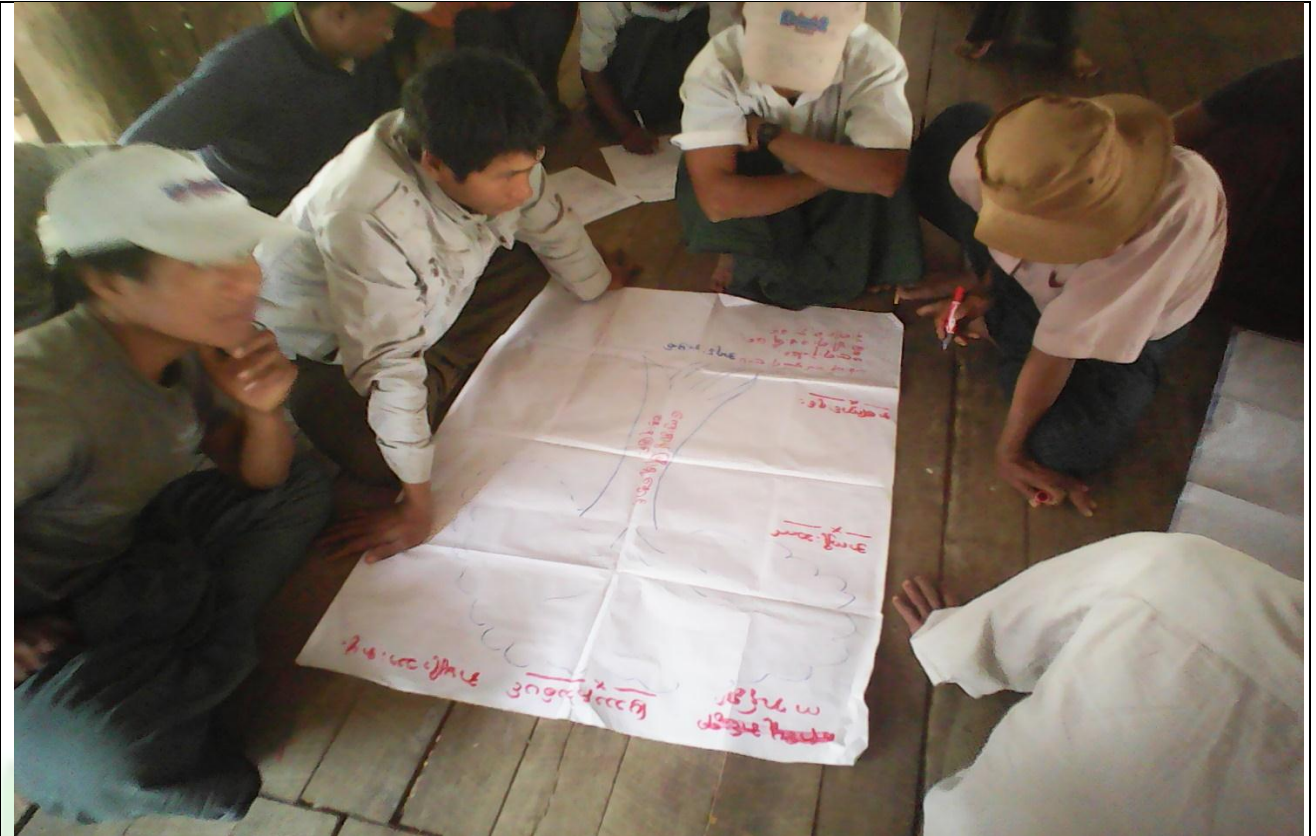
ဖွံ့ဖြိုးရေးအစီအစဉ်ရေးဆွဲခြင်း မှတ်တမ်းဓာတ်ပုံ