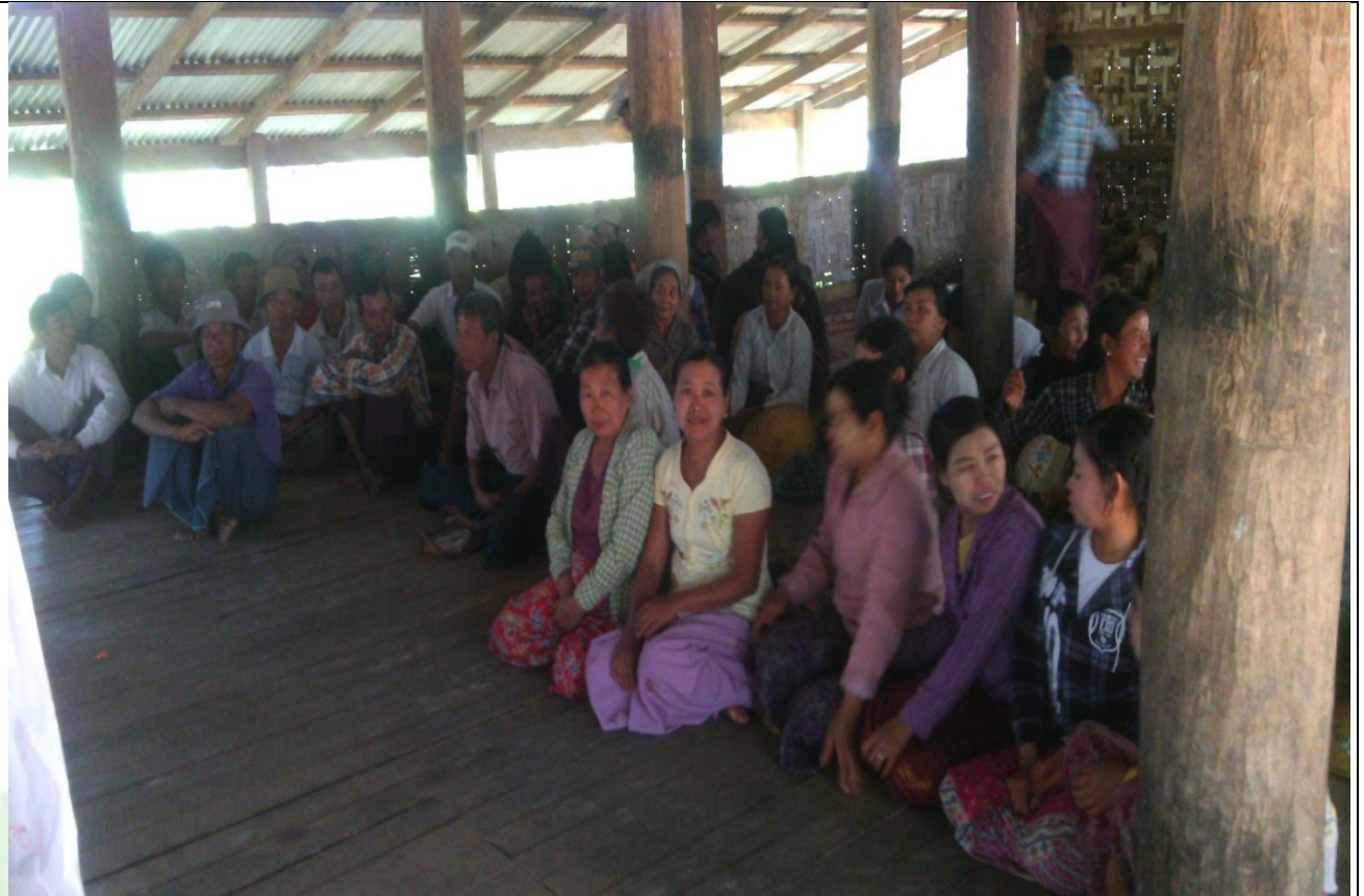
စေတနာ့ဝန်ထမ်းများ ရွေးချယ်ခြင်း မှတ်တမ်းဓာတ်ပုံ