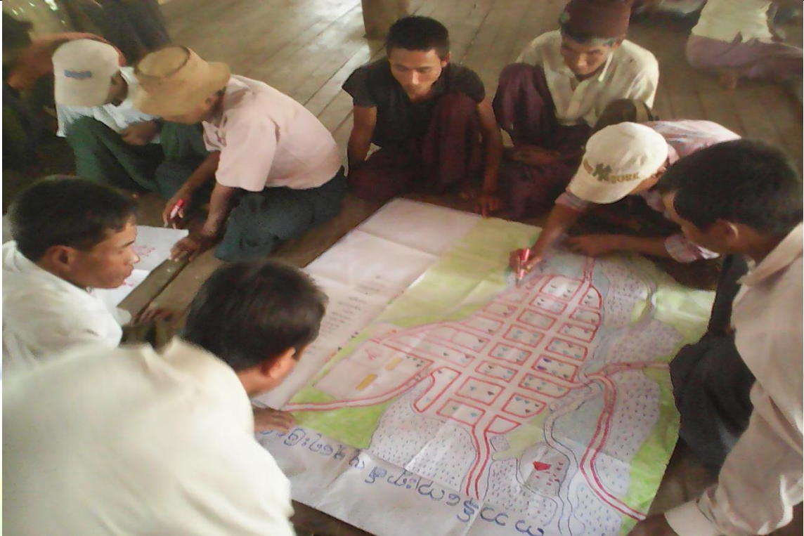
အမျိုးသားအုပ်စု၏ မှတ်တမ်းခါတ်ပုံ