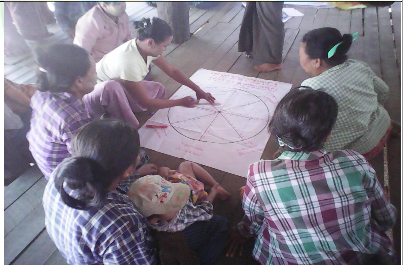
ထိခိုက်လွယ်အုပ်စုများ၏ မှတ်တမ်းဓါတ်ပုံ