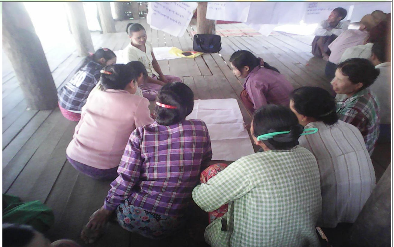
အမျိုးသမီးအုပ်စု၏ မှတ်တမ်းခါတ်ပုံ