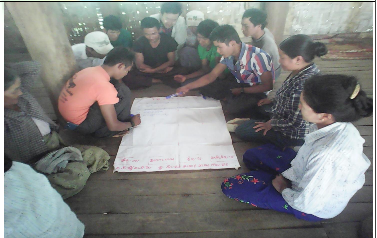
ဖွံ့ဖြိုးရေးအစီအစဉ်ရေးဆွဲခြင်း မှတ်တမ်းဓာတ်ပုံ