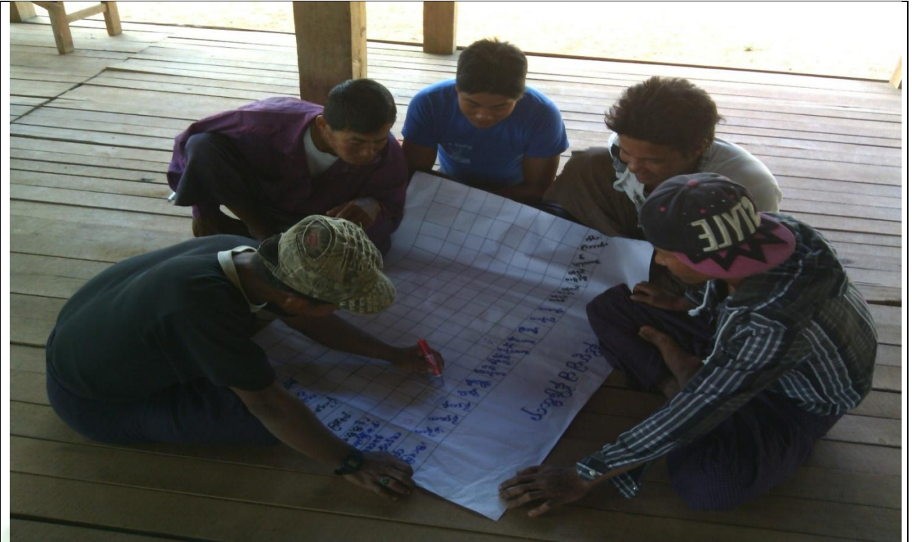
လူငယ်အုပ်စု၏ မှတ်တမ်းဓါတ်ပုံ