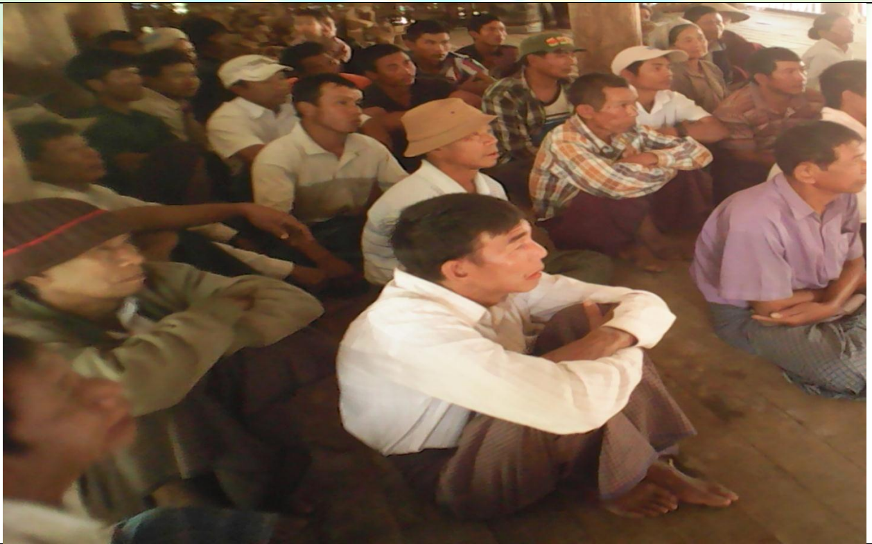
ကော်မတီရွေးချယ်ခြင်း မှတ်တမ်းဓာတ်ပုံ