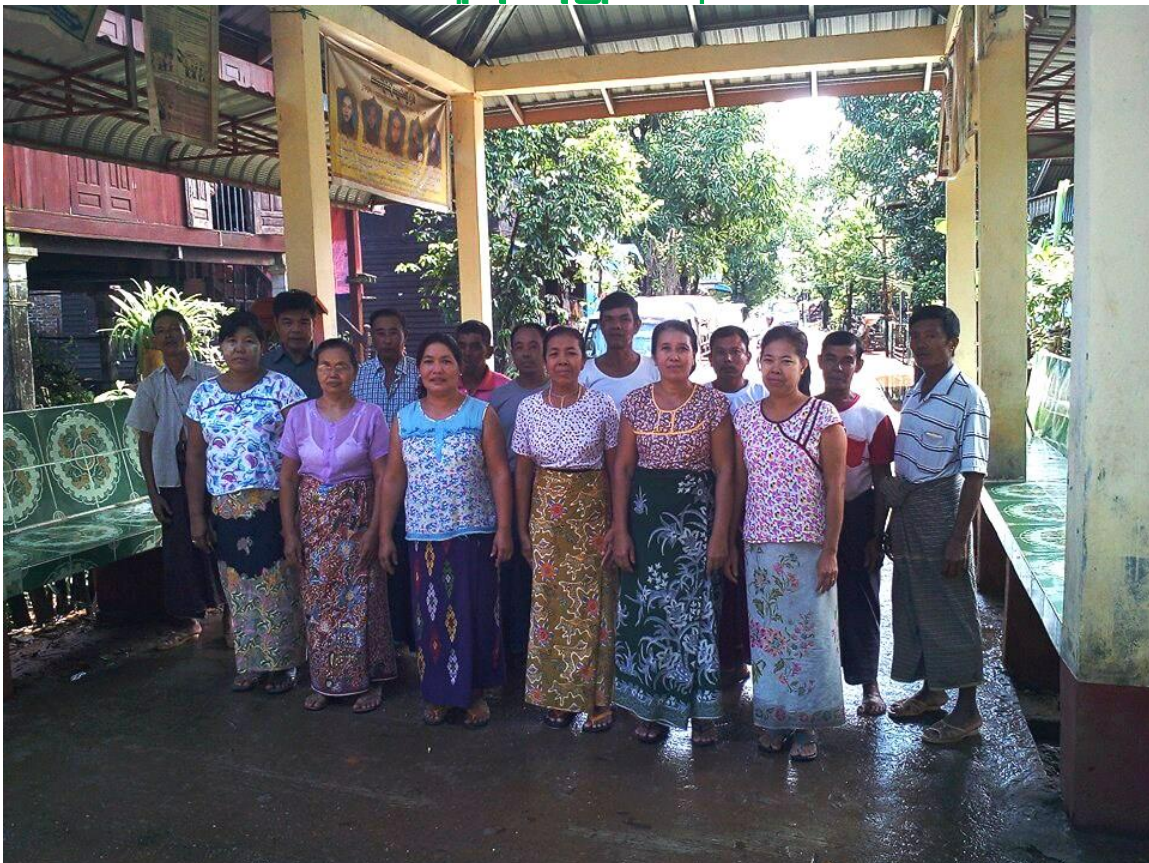
ကော့ဝိုင်းကျေးရွာအုပ်စု၊ ကော့တာကျေးရွာ ကော့ကရိတ်မြို့နယ်၊ ကရင်ပြည်နယ် ကျေးရွာဖွံ့ဖြိုးရေးအစီအစဉ် ၂၀၁၉ ခုနှစ်