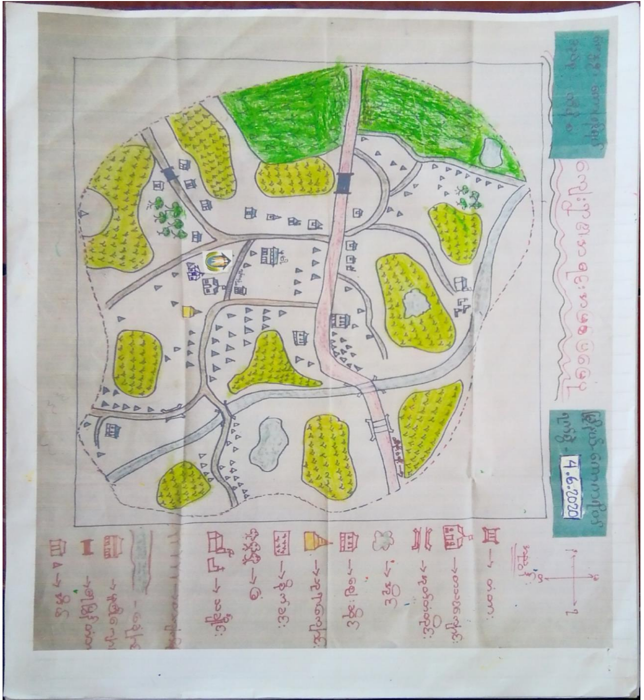
၆.၁။ လူမှုရေးနှင့်အရင်းအမြစ်ပြမြေပုံ (Social and Resource Map)