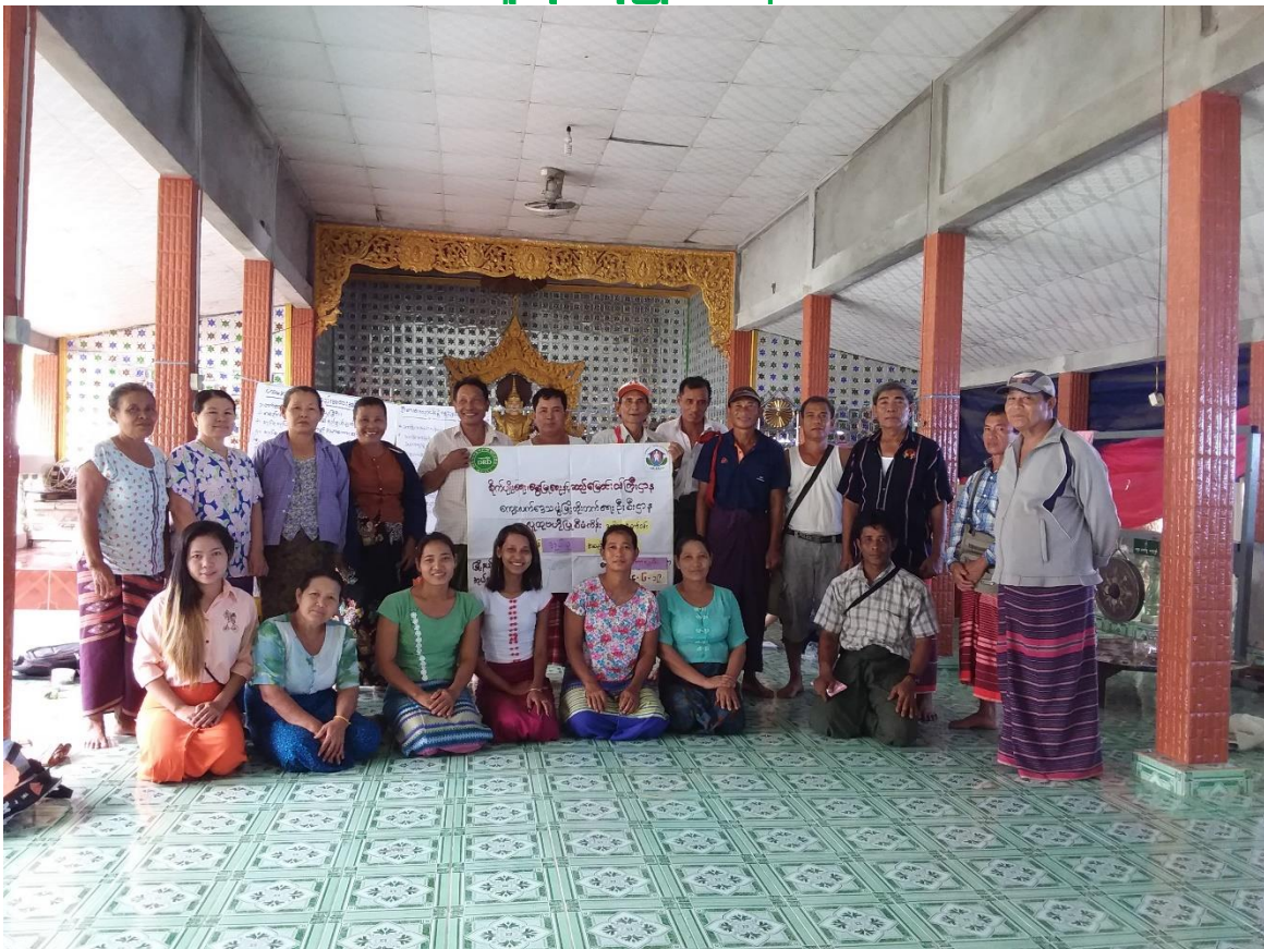
ကော့လျှမ်းကျေးရွာ ကော့လျှမ်းကျေးရွာအုပ်စု၊ ကော့ကရိတ်မြို့နယ်၊ ကရင်ပြည်နယ် ကျေးရွာဖွံ့ဖြိုးရေးအစီအစဉ် ၂၀၁၉ ခုနှစ်