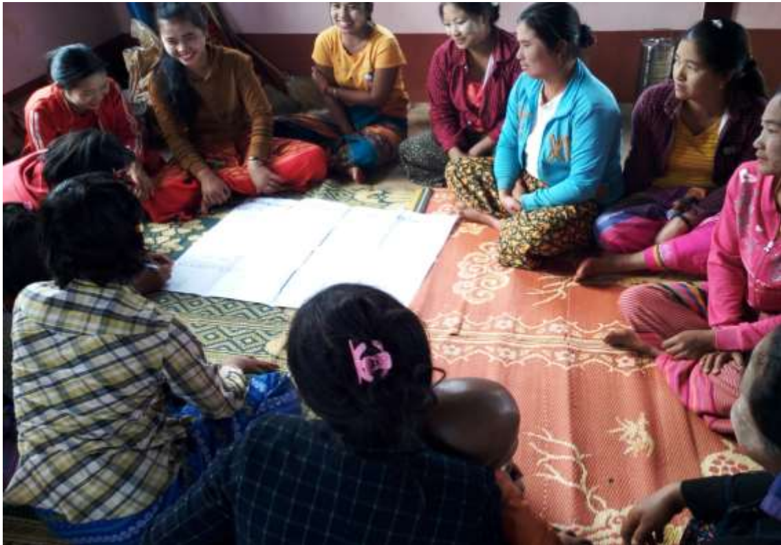
၇။ ကော်မတီဝင်များရွေးချယ်ခြင်းနှင့် ကျေးရွာဖွံ့ဖြိုးရေးအစီအစဉ် ဆောင်ရွက်မှု မှတ်တမ်း ဓါတ်ပုံများ