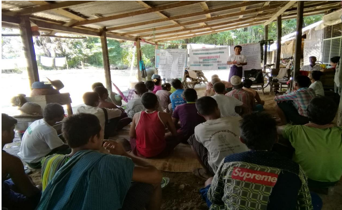
၇။ ကော်မတီများရွေးချယ်ခြင်းနှင့်ကျေးရွာဖွံ့ဖြိုးရေးအစီအစဉ်ဆောင်ရွက်မှု မှတ်တမ်းဓာတ်ပုံ