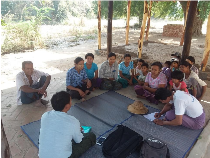
Village Development Plan (VDP)