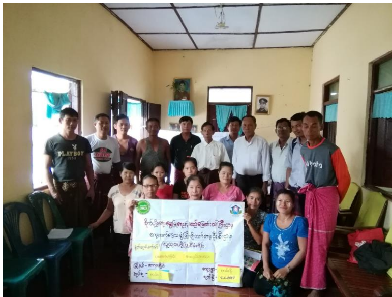
ကရင်ပြည်နယ်၊ ကော့ကရိတ်မြို့နယ်၊ ကမ်းနီကျေးရွာအုပ်စု ကမ်းနီကျေးရွာ၏ ဖွံ့ဖြိုးရေးအစီအစဉ်