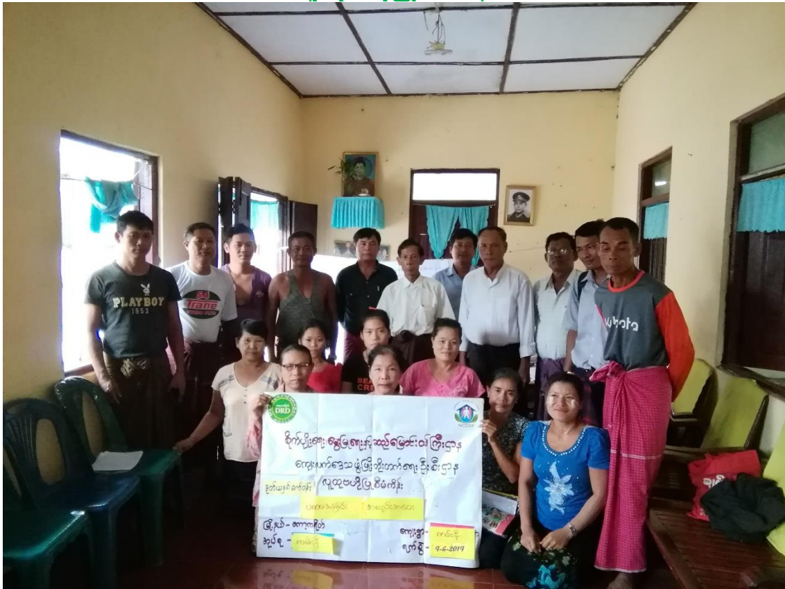
ကမ်းနီကျေးရွာ ကမ်းနီအုပ်စု၊ ကော့ကရိတ်မြို့နယ်၊ ကရင်ပြည်နယ် ကျေးရွာဖွံ့ဖြိုးရေးအစီအစဉ် ၂၀၁၉-ခုနှစ်