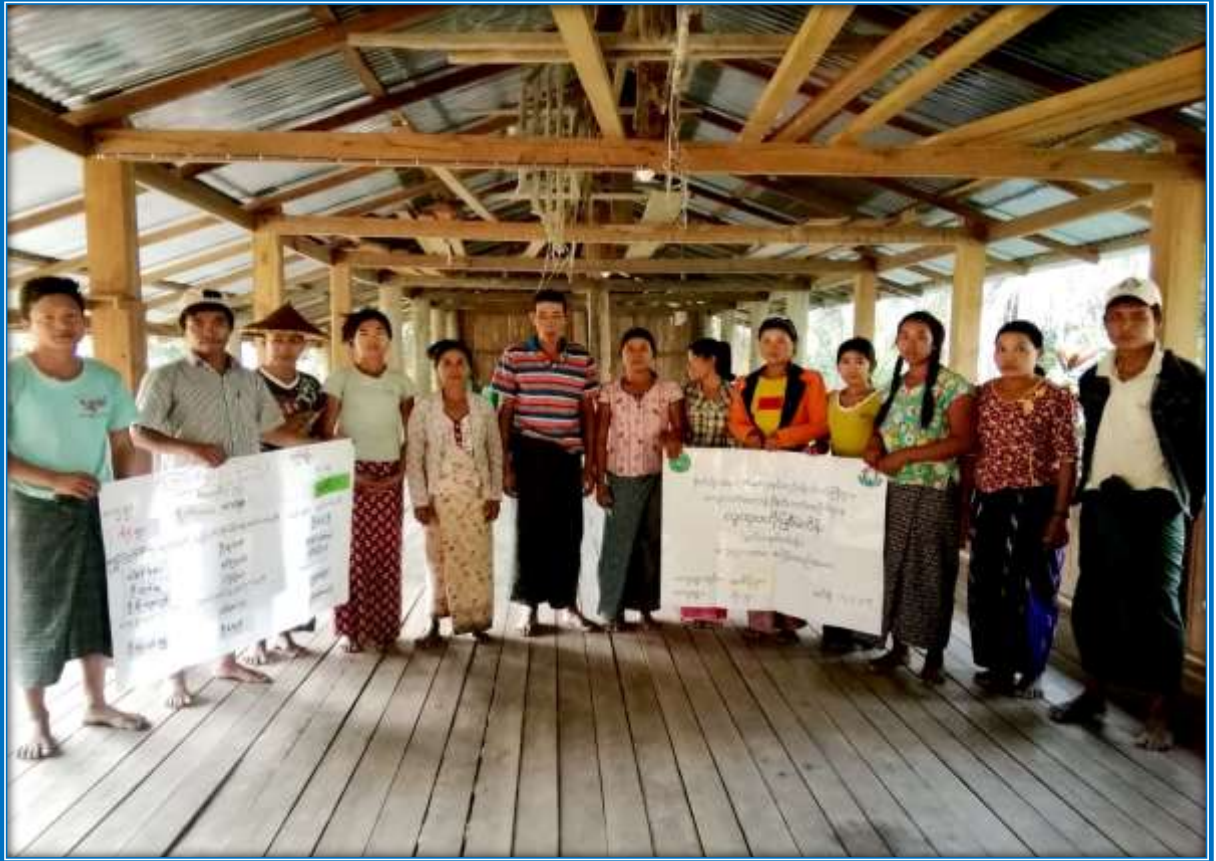
၇။ ကော်မတီဝင်များရွေးချယ်ခြင်းနှင့် ကျေးရွာဖွံ့ဖြိုးရေးအစီအစဉ်ဆောင်ရွက်မှု မှတ်တမ်းဓာတ်ပုံများ