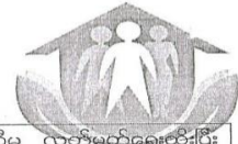
ပုံစံ - ၁ - ၄ ကျေးရွာအုပ်စုစီမံကိန်းလုပ်ငန်းခွဲရွေးချယ်ခြင်းပုံစံ (Form PC 4)

လမ်းညွှန်ချက်။ စီမံကိန်းလုပ်ငန်းခွဲရွေးချယ်မှုအစည်းအဝေးပြီးနောက်တွင် ကျေးရွာအုပ်စုမှ CF/TF တို့၏ အကူအညီရယူ၍ ကျေးရွာစီထောက်ကော်မတီမှ လက်မှတ်ရေးထိုးပြီး အဆိုပါပုံစံအား ပြည့်စုံအောင်ဖြည့်သွင်းရမည်။ ဤပုံစံအား ပြည့်စုံစွာဖြည့်သွင်းပြီးပါက ကျေးရွာအုပ်စုဖွံ့ဖြိုးတိုးတက်ရေးစီမံချက်တွင် TPIC သို့ ပေးပို့ရန်အတွက် နောက်ဆက်တွဲအဖြစ် ထားရှိရမည်။ CF မှ ကျေးရွာတစ်ရွာချင်းစီ၏ စီမံကိန်းလုပ်ငန်းခွဲဆိုင်ရာ အချက်အလက်များကို MIS သို့ ထည့်သွင်းရမည်။ (ယခုနစ်စီမံကိန်းလုပ်ငန်းခွဲ မလုပ်ကိုင်သော ကျေးရွာများ မပါဝင်ပါ။)