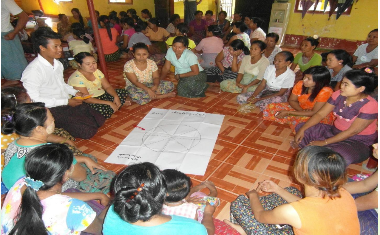
အမျိုးသမီးအုပ်စု၏ မှတ်တမ်းဓာတ်ပုံ