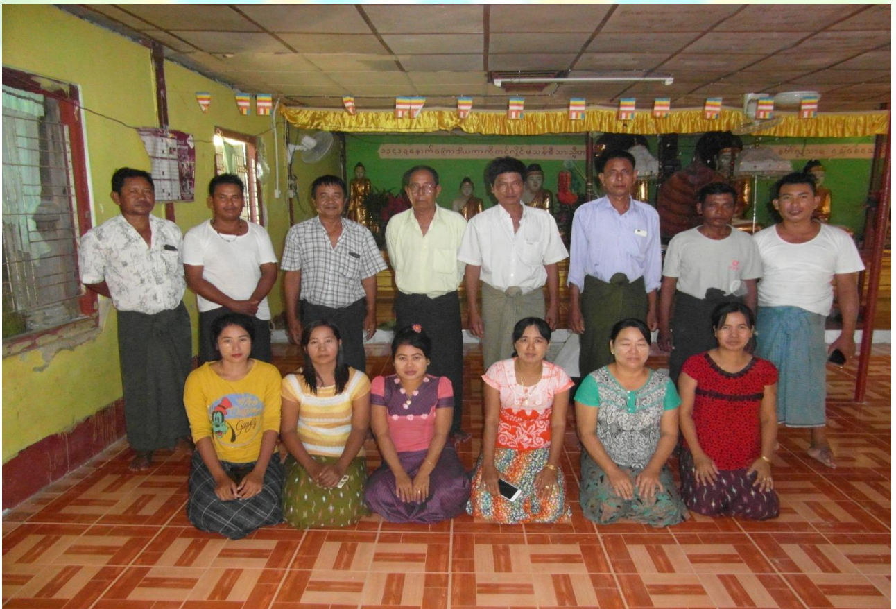
ကော်မတီများ၏ မှတ်တမ်းဓာတ်ပုံ