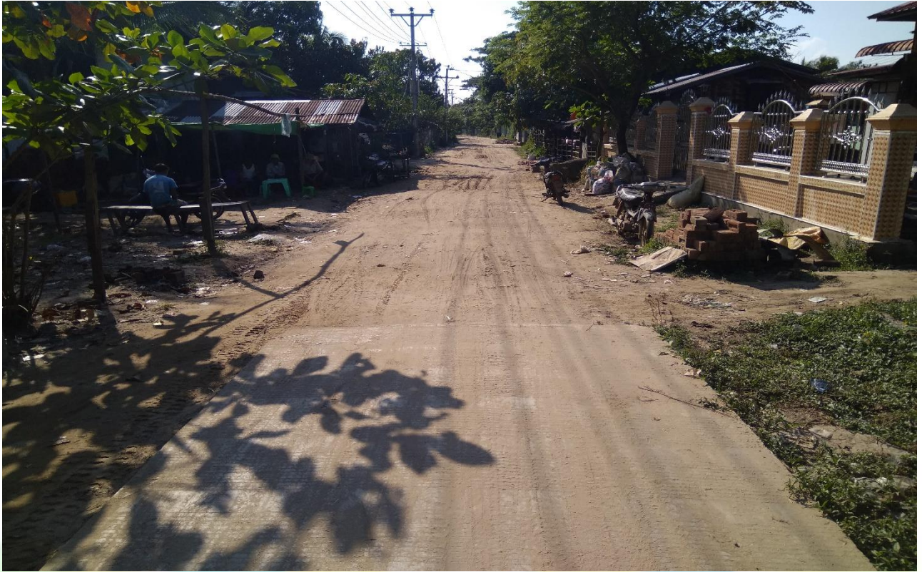
လုပ်ငန်းခွဲ မဆောင်ရွက်မီ မှတ်တမ်းဓာတ်ပုံ