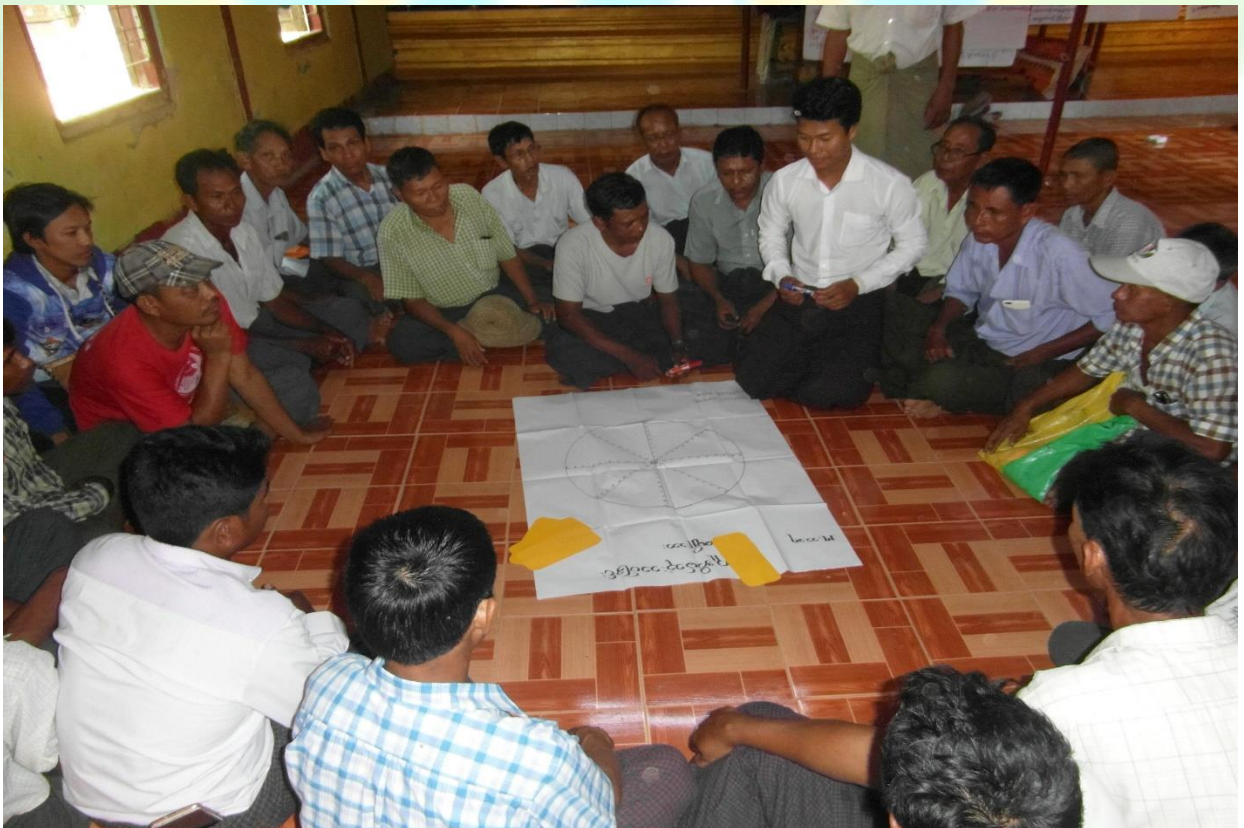
အမျိုးသားအုပ်စု၏ မှတ်တမ်းဓာတ်ပုံ