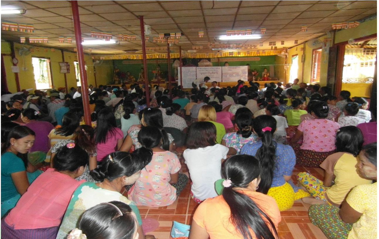
ကော်မတီရွေးချယ်ခြင်းမှတ်တမ်းဓာတ်ပုံ