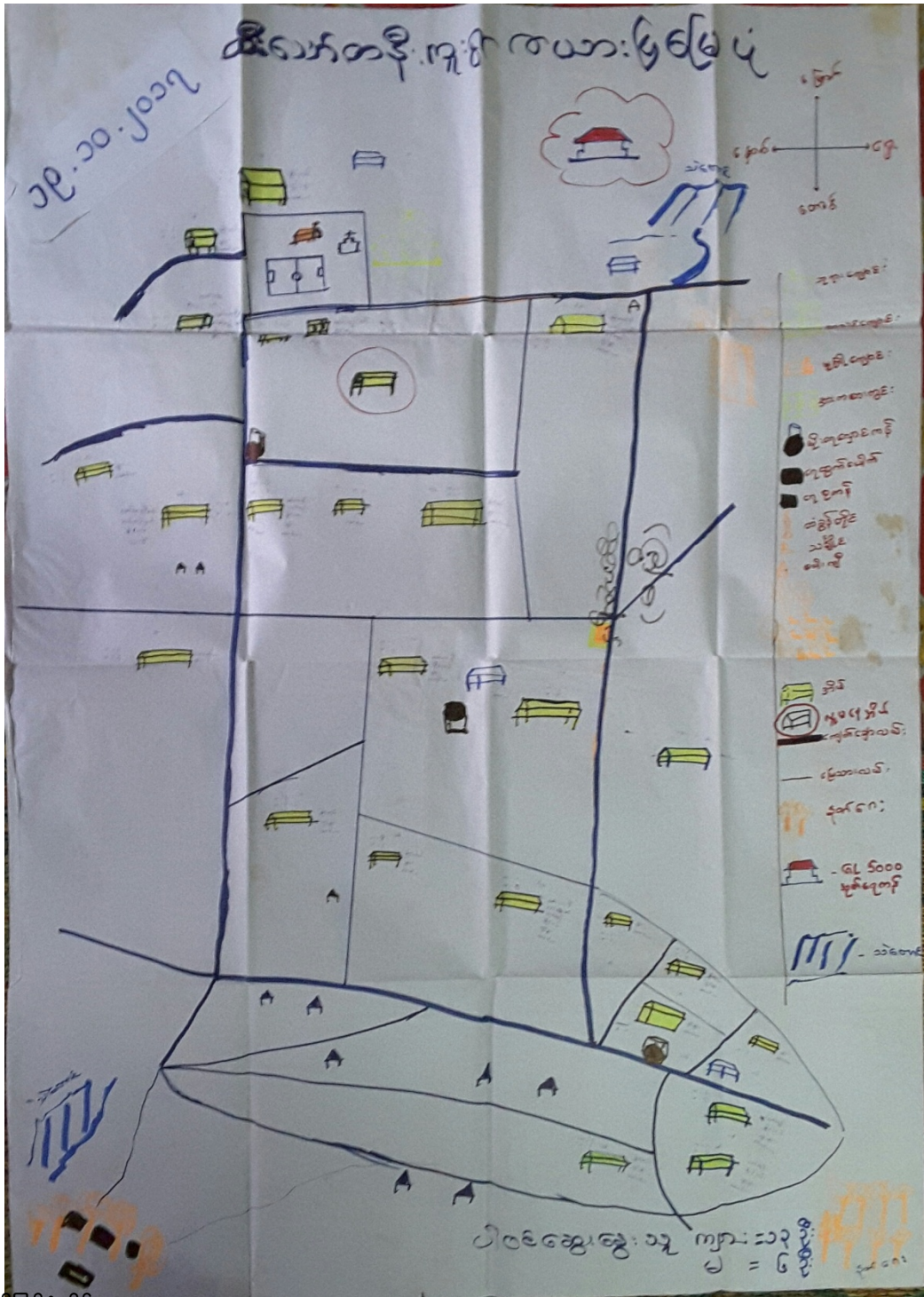
လူထုတက်ပြုစီမံကိန်း