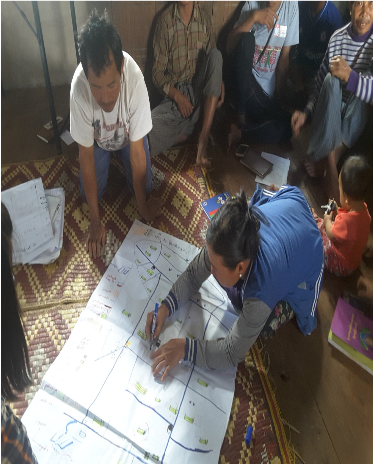
လူထုဗဟိုပြုစီမံကိန်း