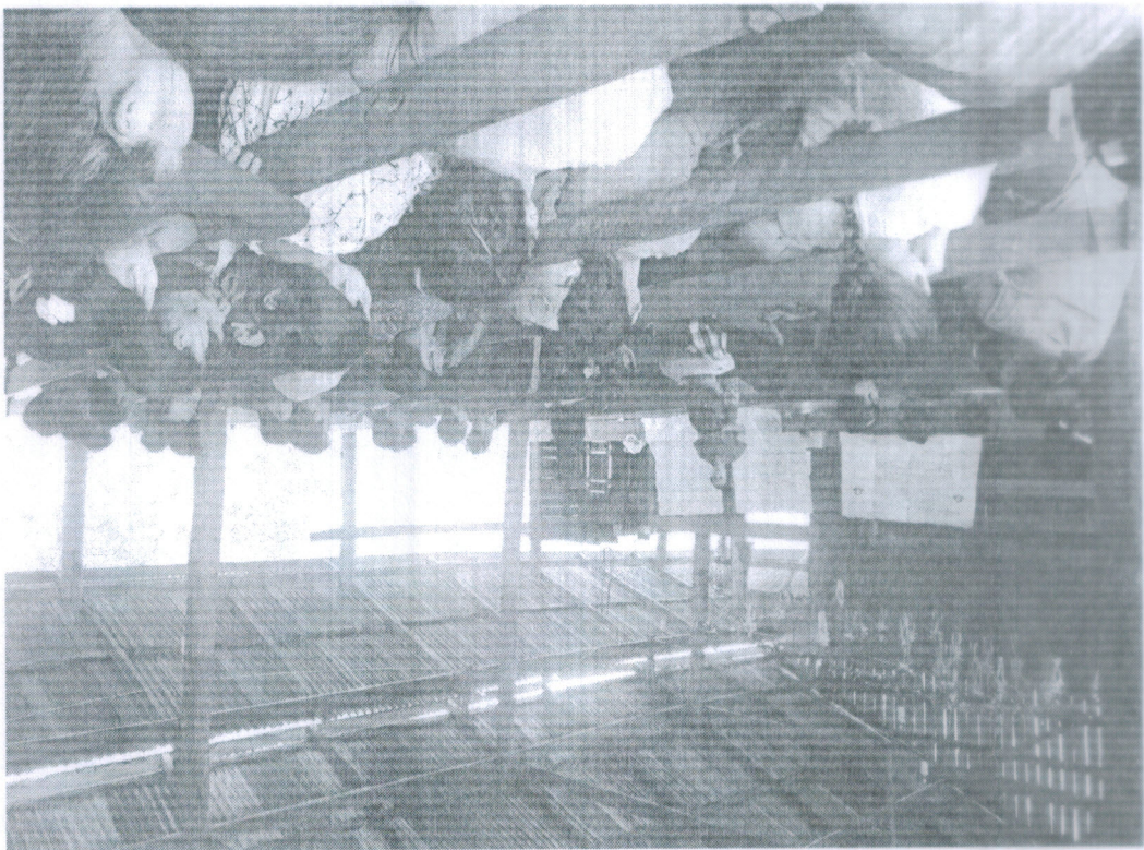
းစွာသဟာန်နိဗ္ဗာန်ဗိမ္ဗာန်ဝေဇာဒိဋ္ဌိတရားစားစားကြိုစိုက်လေးပါစ