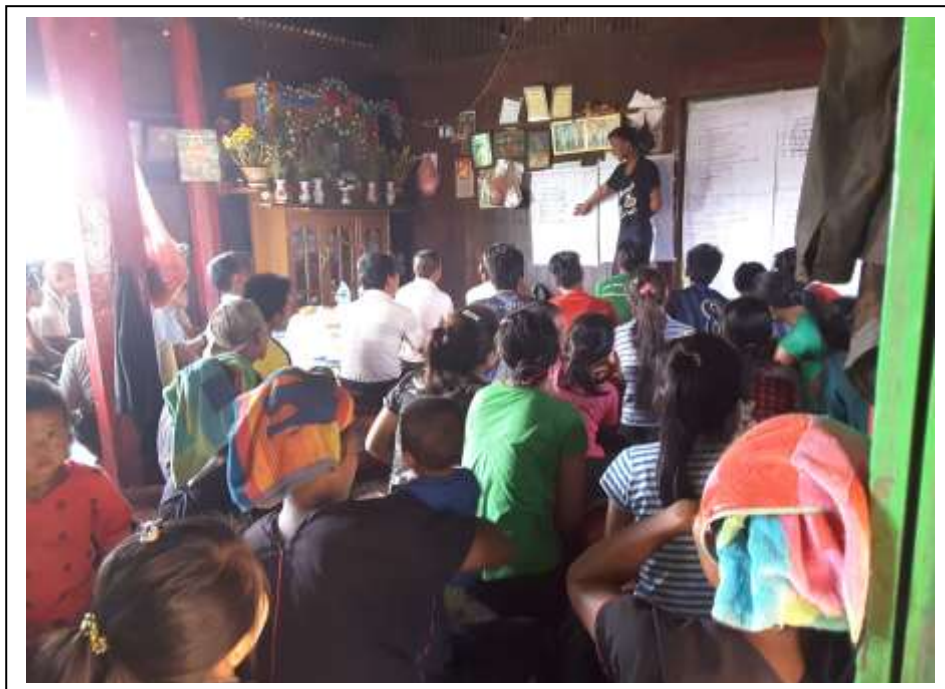
ကျေးရွာသားတစ်ဦးကတင်ဆက်ပေးနေပုံ