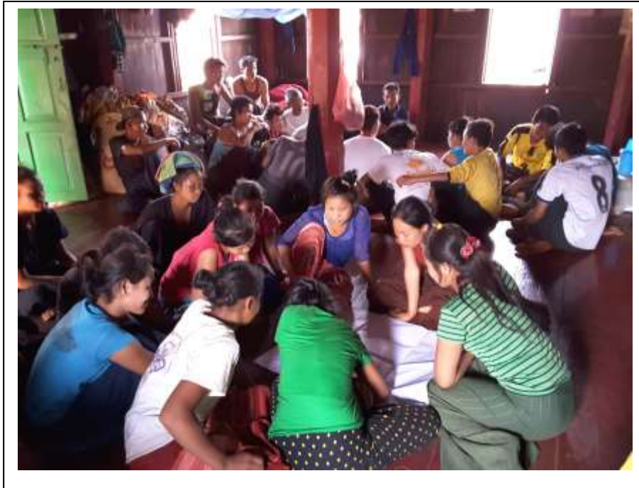
အမျိုးသမီးများ အခက်အခဲ /မျော်မှန်ချက်နှင့် ဖွံ့ဖြိုးရေးလုပ်ငန်းအတွက် စိတ်ဝင်စားစွာ ရေးဆွဲနေပုံ