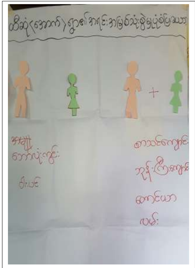
အရင်းအမြစ်သုံးစွဲမှုနှင့် ထိန်းချုပ်မှုပုံစံများ ပြပုံ