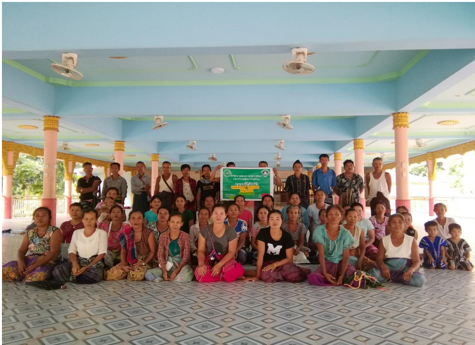
ကရင်ပြည်နယ်၊ ကော့ကရိတ်မြို့နယ်၊ ထီဖိုးစံကျေးရွာအုပ်စု ထီဖိုးစံကျေးရွာ၏ ဖွံ့ဖြိုးရေးအစီအစဉ် ၂၀၂၀ပြည့်နှစ် (တတိယနှစ်စက်ဝန်း)