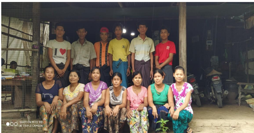
ထန်းပင်ကန်ကျေးရွာအုပ်စု၊ ထန်းပင်ကန်ကျေးရွာ ၂၀၁၉-ခုနှစ်

လူထုဗဟိုပြုစီမံကိန်း အင်္ဂပူမြို့နယ် ၊ ဧရာဝတီတိုင်းဒေသကြီး ကျေးရွာဖွံ့ဖြိုးရေးအစီအစဉ်