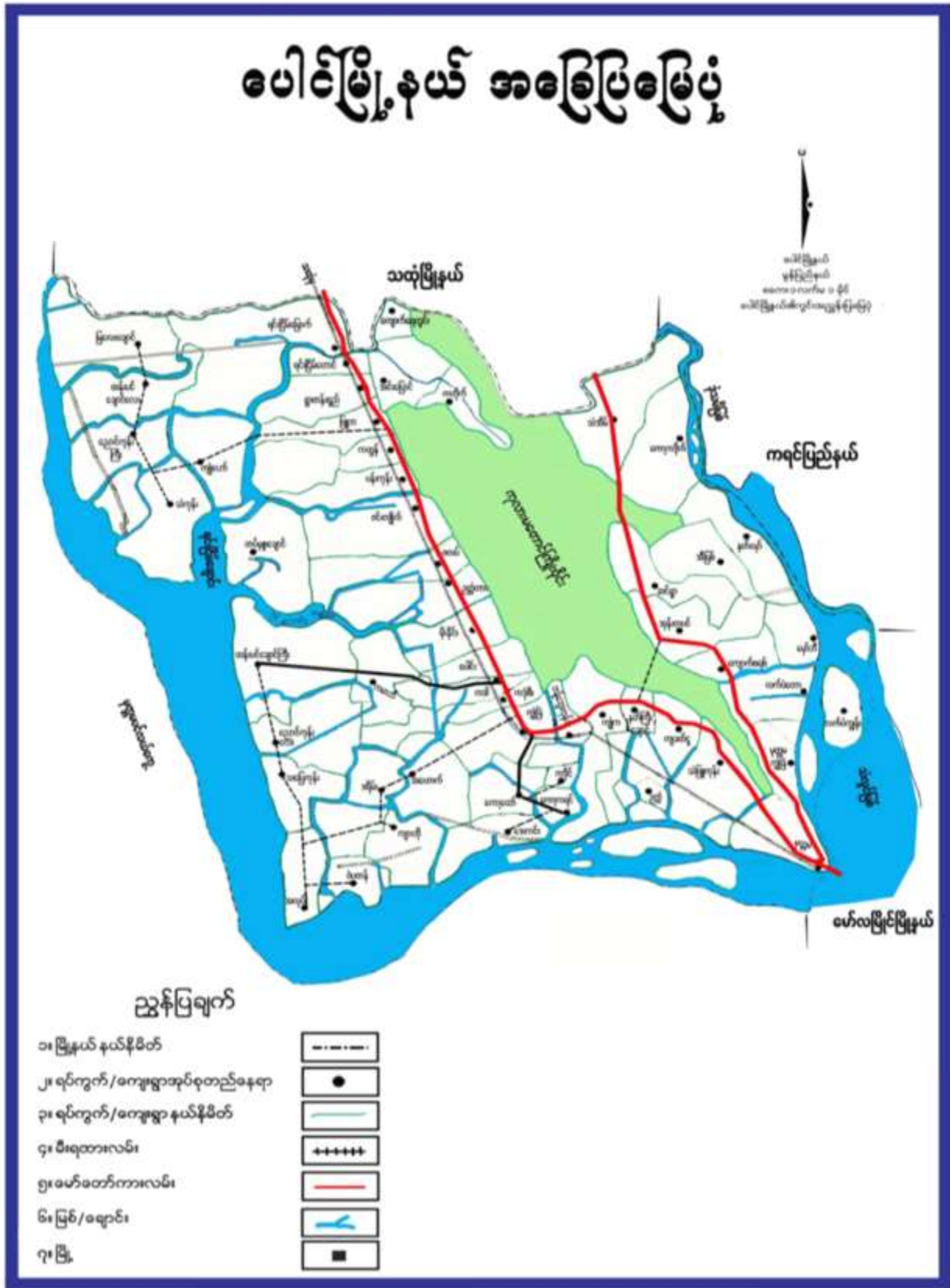
ထန်းပင်ချောင်ရွာကြီးကျေးရွာ၊ထန်းပင်ချောင်ကြီးကျေးရွာအုပ်စု၊ပေါင်မြို့နယ်