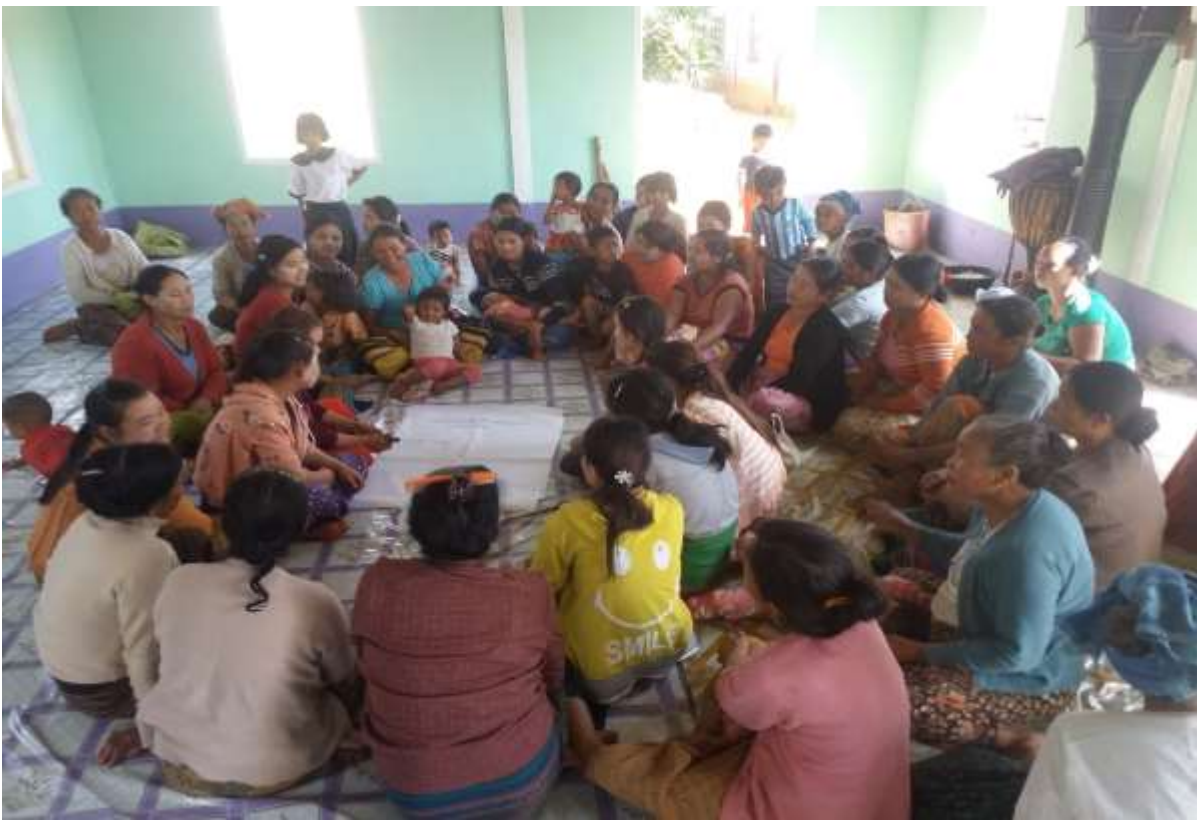
၈။ ကျေးရွာအချက်အလက် (ပုံစံ ၈-၁)