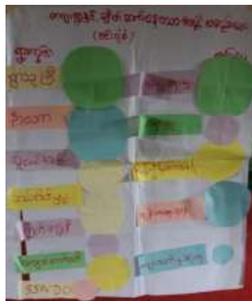
ရွာလှည့်ရှာဖွေမှု အောက်စီစဉ်: ကျေးရွာ- နက္ခတ်စဉ် ချိတ်ဆက်မှု (မင်း) ပုံစံ