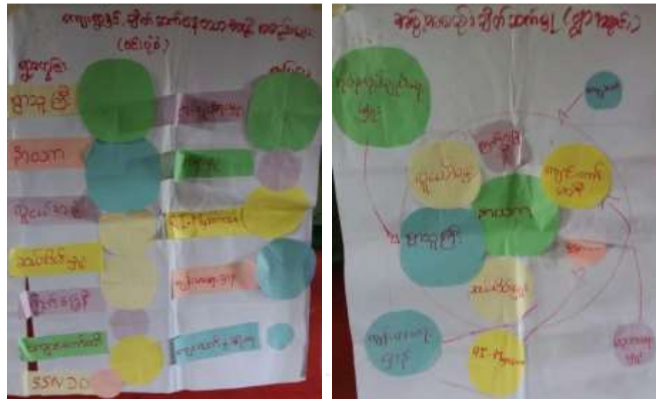
ရွာလှည့်ပွဲနှင့် အထောက်အကူပြုပေးသော ကမ္ဘာ့ကမ္ဘာ့ ချိတ်ဆက်မှု (မင်) ပုံစံ