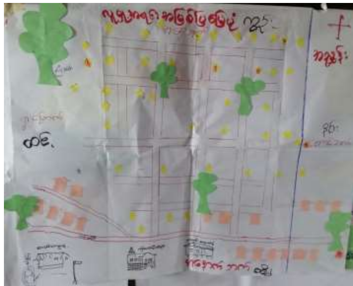
လွယ်ပွတ်ကုလို၊ စောက်တိုင်းကျေးရွာ လူမှုရေး အရင်းအမြစ်ပြမြေပုံ