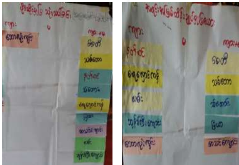
ပိုင်ဆိုင်မှုအမျိုးအစား၊ တောကင်းခြင်း၊ တောဖွား ဝိုင်းရိုင်းခြင်း၊ မြေလောင်း

ပိုင်ဆိုင်မှုသုံးသပ်ခြင်း (အရင်းအမြစ်သုံးစွဲမှုနှင့် ထိန်းချုပ်မှုပုံစံပြုလောင်း)