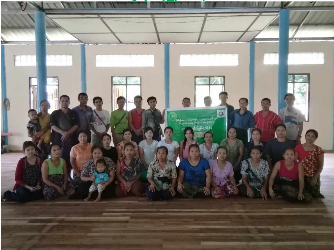
မြောက်ကြာအင်းကျေးရွာအုပ်စု၊ ဖန်ခါးကုန်းကျေးရွာ ကော့ကရိတ်မြို့နယ်၊ ကရင်ပြည်နယ် ကျေးရွာဖွံ့ဖြိုးရေးအစီအစဉ် ၂၀၁၉ - ခုနှစ်