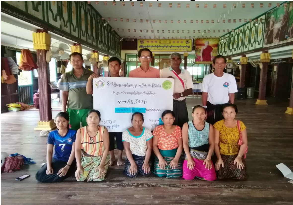
နဘူးနှစ်ခြားကျေးရွာအုပ်စု၊ ဘုရားကုန်းကျေးရွာ ၂၀၁၉ - ခုနှစ်

လူထုပဟိုပြုစီမံကိန်း ကျေးလက်ဒေသဖွံ့ဖြိုးရေးဦးစီးဌာန ကျေးရွာဖွံ့ဖြိုးရေးအစီအစဉ်