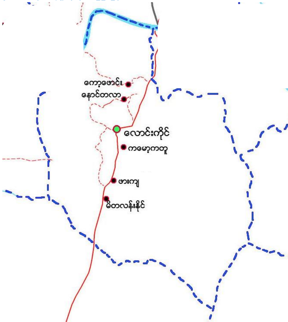
၃။ လောင်းကိုင်ကျေးရွာအုပ်စုတွင်ပါဝင်သော ကျေးရွာများစာရင်း