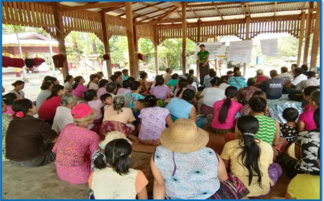
၇။ ကော်မတီဝင်များရွေးချယ်ခြင်းနှင့် ကျေးရွာဖွံ့ဖြိုးရေးအစီအစဉ်ဆောင်ရွက်မှု မှတ်တမ်းဓါတ်ပုံများ