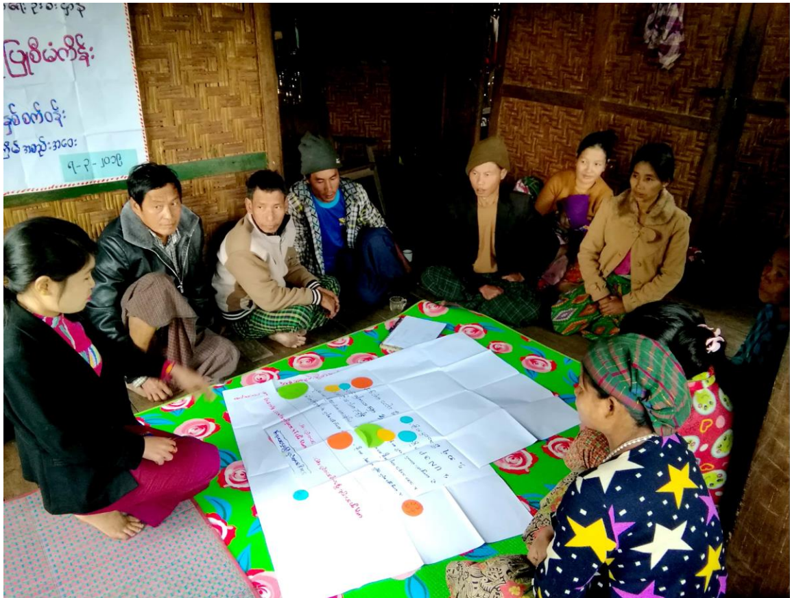
၇။ ကော်မတီဝင်များရွေးချယ်ခြင်းနှင့် ကျေးရွာဖွံ့ဖြိုးရေးအစီအစဉ် ဆောင်ရွက်မှု မှတ်တမ်းဓါတ်ပုံများ