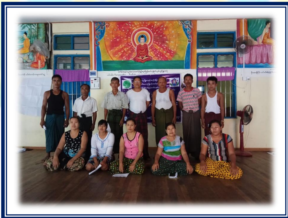
ကျေးရွာဖွံ့ဖြိုးတိုးတက်ရေး လုပ်ငန်းအကောင်အထည်ဖော်မှုအစီအစဉ် (အဘစ်ကျေးရွာအုပ်စု၊ နီးမုတ်ကျေးရွာ)