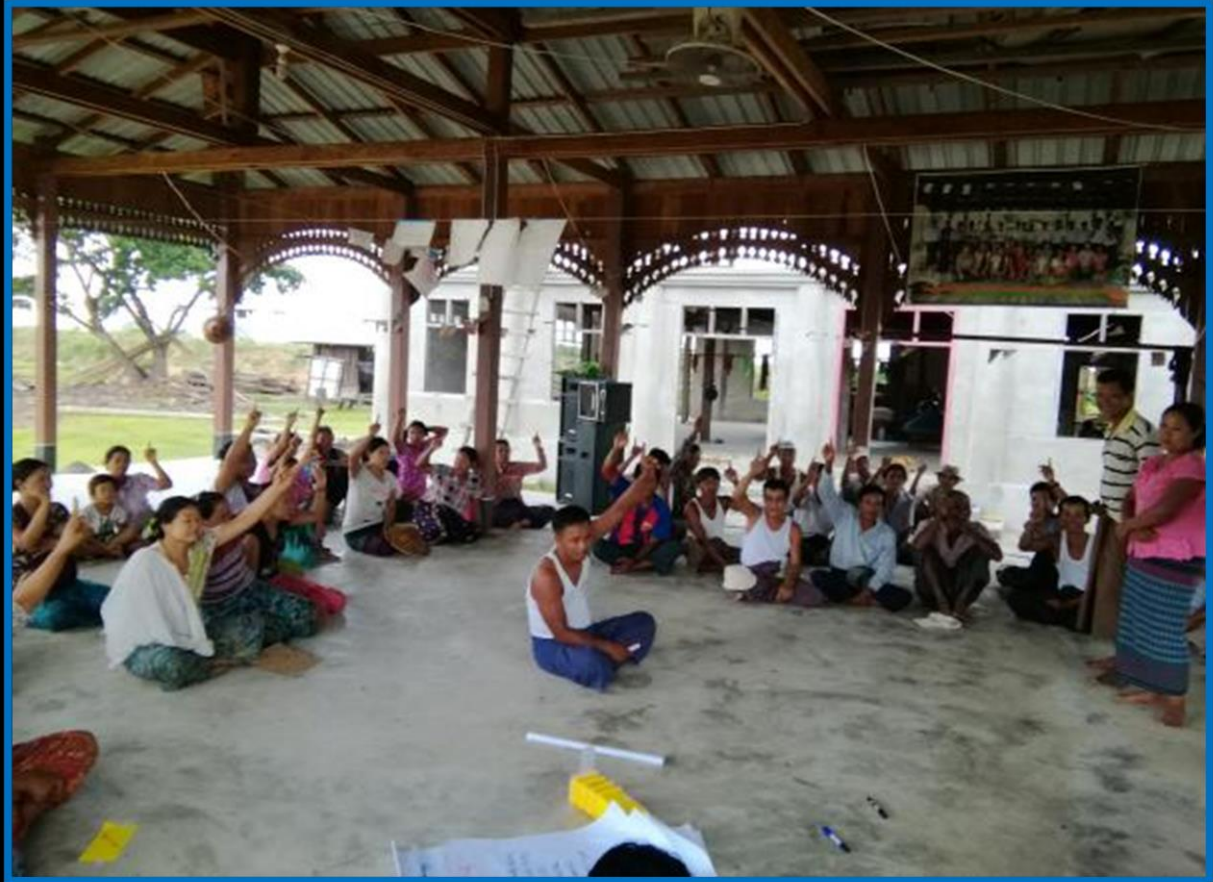
၇။ ကော်မတီဝင်များရွေးချယ်ခြင်းနှင့် ကျေးရွာဖွံ့ဖြိုးရေးအစီအစဉ်ဆောင်ရွက်မှု မှတ်တမ်းဓာတ်ပုံများ