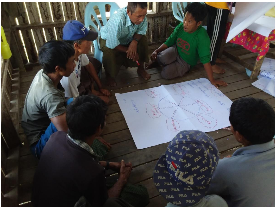
အမျိုးသားများ PRA Tools ဆောင်ရွက်နေမှု မှတ်တမ်း