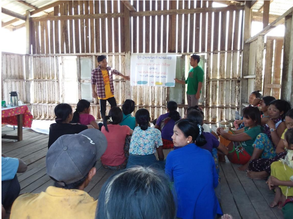
ပထမအကြိမ် ကျေးရွာစီမံကိန်းမိတ်ဆက်အစည်းအဝေး ဆောင်ရွက်ပုံ