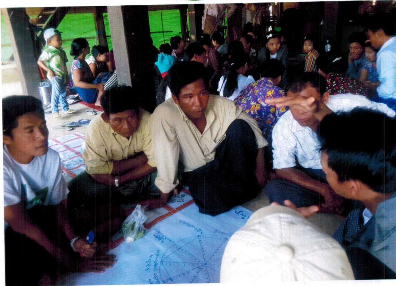
Village Development Plan